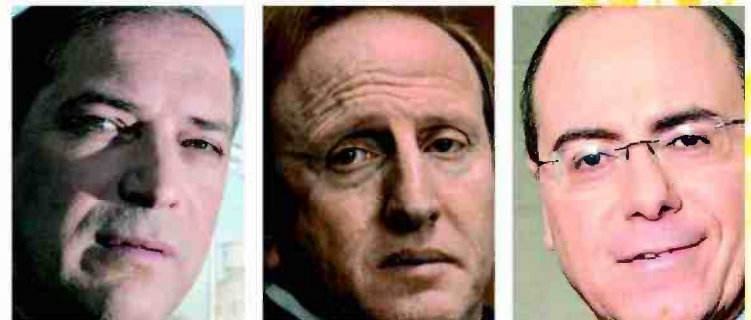
חש מחויב לפעול. שלום

"אין לי מושג. לכל אחד יש אג'נדה משלו. אני לא חוקר כליות ולב, ואני לא יכול לדעת האם המניעים שלה הם פוליטיים, איריאולוגיים, פוסט-ציוניים או משפטיים. בכל מקרה, התחושה שלנו היא שיש פה סחבת מטורפת, ושעושים הכול כדי לעקר את המהלך שנועד להסדיר את החוות. החוק שעבר כבר לפני שנתיים, קצב לוועדה 18 חודשים לסיים את