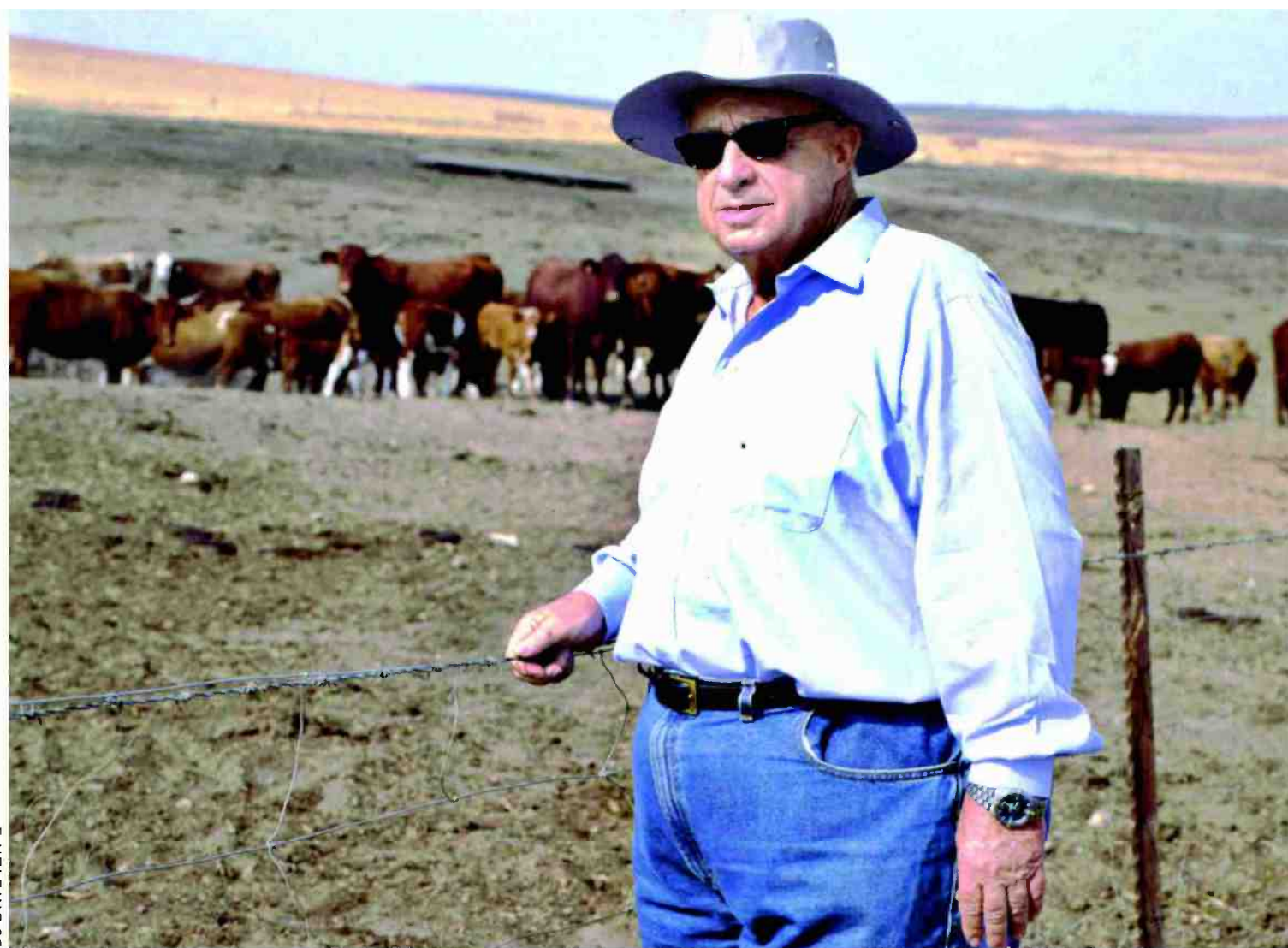
החוזה היחידה בצפון הנגב שאפשר לישון בה בשקט. שרון בחוות השקמים