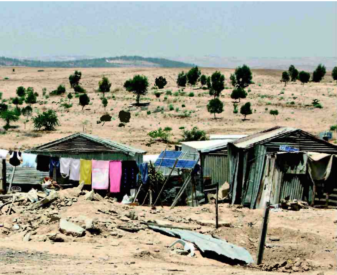
עוברים מחברון לנגב הצפוני. השתלטות בדווית בנגב

דבר. היו תיקים שהתנהלו, היו תביעות שהתנהלו. בדקנו אותן אל מול הסמכויות של הוועדה, אל מול מה שהוועדה עשתה. צריך גם להבין שהחוות הן לא מקשה אחת, יש מדרגים."