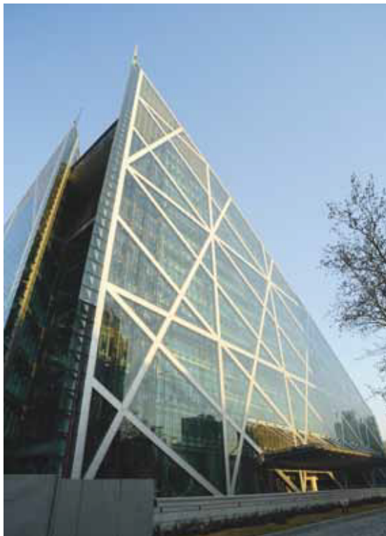
בניין GreenView, סיין

קנארי וורף הוא מתחם משרדים בקנה מידה גדול שנבנה בסטנדרטים הגבוהים ביותר. עם שטח של 86 דונם הכולל עשרה בנייני משרדים, איזור מסחר מרובה קומות, תחנת רכבת קלה של דוקלנדס, ומרכז כנסים ואירועים. דומאון מערכת אנרגיה לבניינים מותקנת בשמונת בנייני המשרדים העיקריים שלה, כולל בניין השירותים הפיננסיים בניין, מגדל Citibank, הנהלת בנק ברקליס העולמית ואת One Canada Square. מערכת דומאון שולטת בטמפרטורה ובניהול אספקת החשמל, לסביבת עבודה טובה יותר, יעילות ניתוב האנרגיה ושיפור משמעותי בביצועים הסביבתיים.