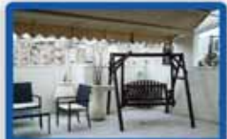
פנטהאוס 6 חדר בהיכר 150 מ"ר בנוי, מחסן, 2 חניות