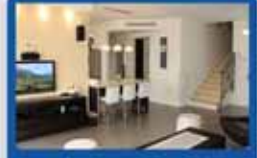
דופלקס מדהים בישראל עירוד 5.5 חדר, 2 מרפסות, 2 חניות