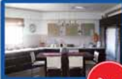
חדרים בנריה ביותר, 130 מ"ר, 2 חניות