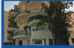
4 חדרים בכרץ עורפית, 95 מ"ר, מעלית וחניה