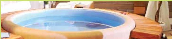
* בכפוף לתנאי המבצעים שנמצאים באתר האינטרנט שלנו

ואותך נפנק בחבילת נופש זוגי בשווי 2000 ש"ח לבחירתך לאחר המכירה*