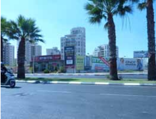
מכערים את הכניסה לשכונה.

לא עוד שכונה בתחילת דרכה, ובהחלט לא אתר בנייה שנתון לחסדי קבלנים ועסקנים, כפר גנים ג היא שכונה מרשימה שמאוכלסת באלפי משפחות