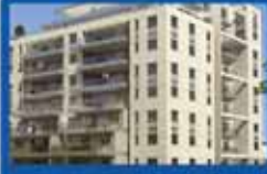
6 חדרים ביטקובסקי פרויקט מורכב בפרדס, 160 מ"ר