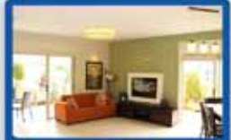
דופלקס-פנטהאוס 5.5 חדר' בכץ חדש, קומה 4-5, מרפסת 70 מ"ר