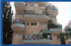
דירת נג 2 חדרים ביטקובסקי 154 מ"ר בנוי, משמש ומייד