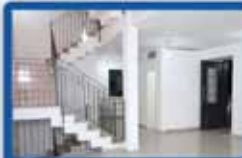
להשכרה דו משפחתי בכפר גנים ג 9 חדר, יח' דיר, מושקע, מייד