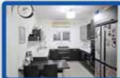
3.5 חדרים בדגל ראובן משופצת מהיסוד, מעלית, חניה