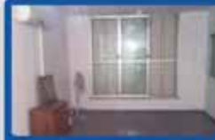
3 חדרים בדגל ראובן עורפית, מרווחת, מעלית, חניה