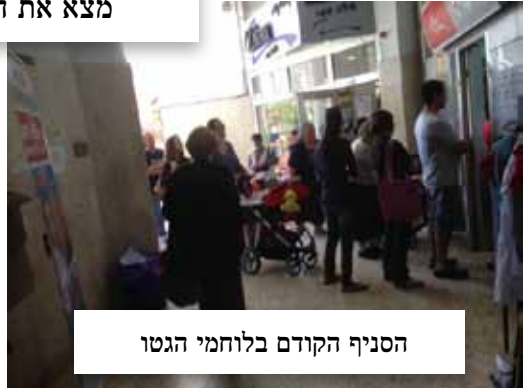
הסניף הקודם בלוחמי הגטו