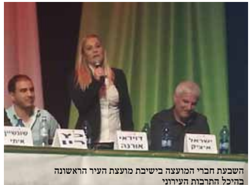
השבת חברי המועצה בישיבת מועצת העיר הראשונה בהיכל התרבות העירוני

פעמים רבות נשים נמנעות מהעיסוק בפוליטיקה ומשליחות ציבורית מאחר שמדובר בפעילות שגוזלת זמן רב ומשאבים, ונשים מעדיפות להקדיש את זמנן למשפחה.