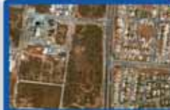
250 מ"ר, מגרש לבניה רויה בכפר גנים ד'