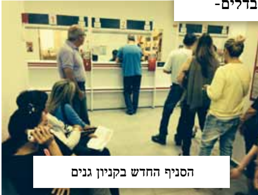
הסניף החדש בקניון גנים