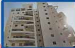
4 חדרים בעממאל קומה ד', 103 מ"ר