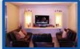
פנטהאוס 5 חדרים בטרוחמפלור 155 מ"ר, 3 מרפסות, מייד, מחסן