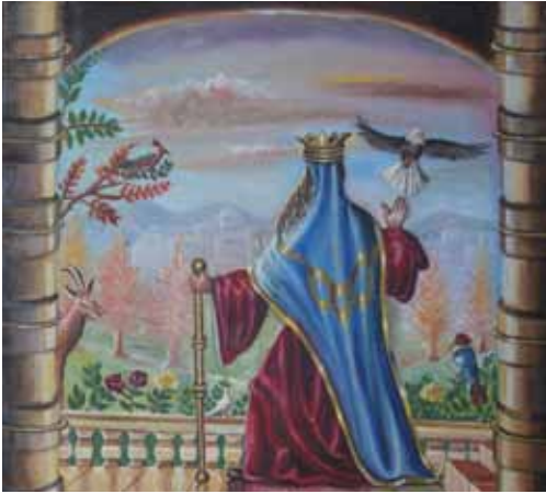
ציורי תנ"ך/שלמה המלך, ציירה: אהובה קליין © (שמן על בד)

ומנגד אנו קוראים על שנאת האחים ליוסף: "... וישנאו אותו ולא יכלו דברו לשלום" (בראשית ל"ז, ה).