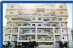
פנטהאוס-דופלקס בעממאל זמיר 7 חדר, 170 מ"ר, מושקע ביותר