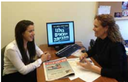
גל עם ח"כ יפעת קריב, כשמועצת התלמידים הארצית השביתה את הלימודים בינואר השנה.

זה עדיין טוב וזה שווה. אני מוצאת את עצמי לומדת בלילות ואני מפסידה לא מעט ימי לימודים, בגלל שאני המון בכנסת והדיונים בבוקר; מועצת התלמידים הארצית היא חברה קבועה בוועדת חינוך, בוועדה לזכויות הילד, בוועדת הכלכלה ולמעשה, משתתפת בכל מה שקשור בנוער, למעט ועדת חוץ וביטחון. בנוסף, אני לא מוותרת על ריקודי ההיפ הופ."