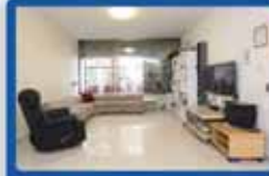
4 חדרים בכרץ ק"א, עורפית, משופצת, מעלית