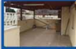
דירת נג 5 חדר ביטקובסקי משופצת, עורפית, משובת, חניה