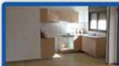
5 חדרים בעצמאות קומה 3, מרפסת, מחסן, 2 חנות