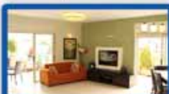
דופלקס-פנטהאוס 5.5 חד' בכץ חדש, קומה 4-5, מרפסת 70 מ"ר