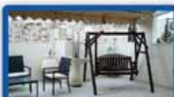
פנטהאוס 6 חד' בהיבנר 150 מ"ר בניי, מחסן, 2 חניות