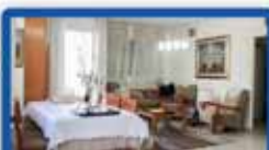
4.5 חד ביהלום עורפית, מ.שמש, מסיד