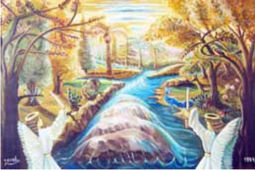
ציור תנ"ך/הכרובים בפתח גן עדן ציירה: אהובה קליין © (שמן על בד)

המלאכים נקראים גם בשם כרובים, שרעפים, ובלשון האגדה הם נקראים פמליה של מעלה, ואילו ישראל נקראים פמליה של מטה