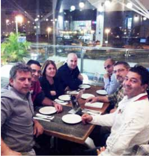
חברי ועד השכונה בישיבה ב"קפית"

ועד שכונה טוב צריך להיות בעל עשייה והצלחות, ולא פחות חשוב מכך- לזכות בשיתוף פעולה מהתושבים ומעובדי העירייה. התברכנו!