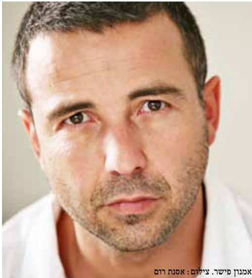
אמנון פישר. צילום: אסנת רום