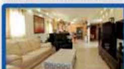
5 חדרים בנימין מושקעת, מעוצבת, מ.שמש, מסיד