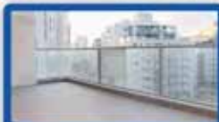
5 חדרים באויערבך קומה 5, 130 מ"ר, מרפסת ענקית