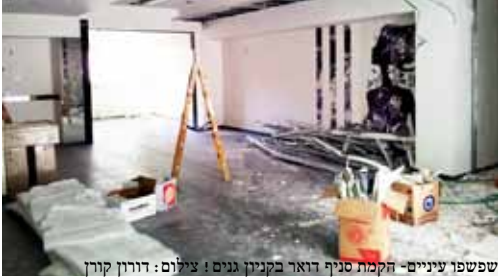
שפשופו עיניים - הקמת סניף דואר בקניון גנים!

סוף-סוף החלה בניית סניף דואר בקניון גנים