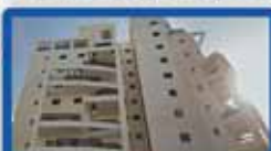
4 חדרים בעצמאות קומה ד', 103 מ"ר