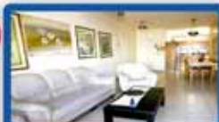
5 חדרים בבן טריון 143 מ"ר, עורפית, 2 מרפסות