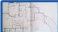
4 חדרים ביטקובסקי פריקט בבנייה, 130 מ"ר קומה ב'