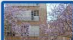
3.5 חדרים בהיבנר ק"א, עורפית, מעלית, חניה