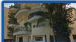
4 חדרים ביטקובסקי 100 מ"ר, מעלית חניה, מ.שמש