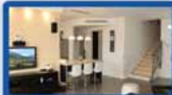
דופלקס מדהים בישראל עידוד 5.5 חד', 2 מרפסות, 2 חניות