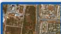
250 מ"ר, מנרב לבניה רוויה בכפר גנים ד'