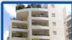
ד.ג 6 חדרים ביוסף נקר 167 מ"ר בניי, 120 מ"ר נינה