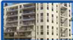
6 חדרים ביטקובסקי פריקט מנרב בפרדס, 160 מ"ר