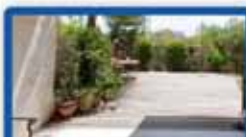
ד.ג 5.5 חדרים בבן טריון 140 בניי, 210 נינה עם ריאוף ודק