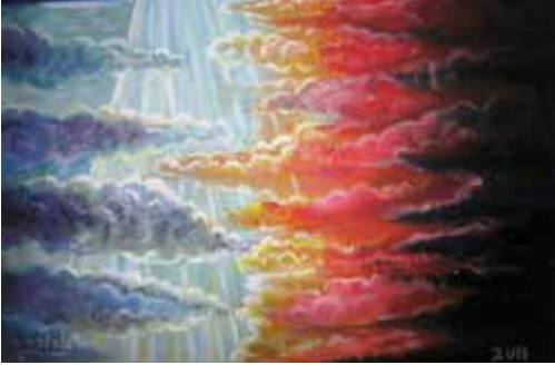
ציורי תנ"ך/ "בריאת האור" ציירה: אהובה קליין © (שמן על בד)

לקראת השנה החדשה מעניין לבחון את מושג ההתחדשות גם בראי התנ"ך