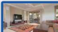
ד.ג 5.5 חדר ביוסף נקר 140 מ"ר בנטי, כניסה נפרדת