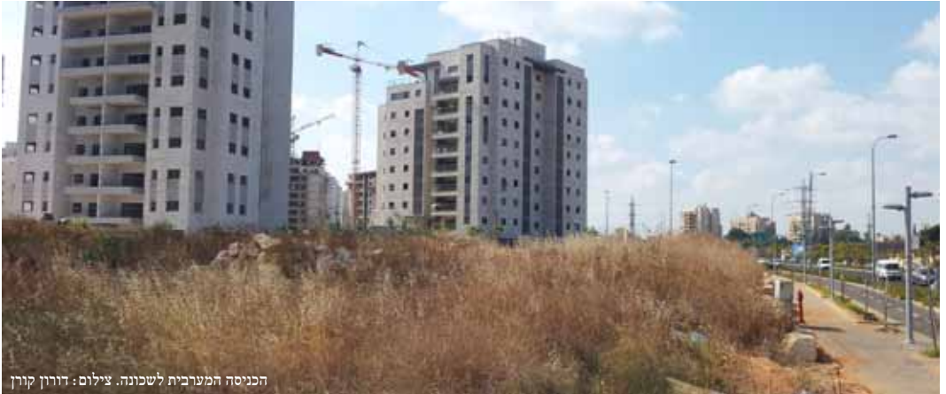
הכניסה המערבית לשכונה.

שנת הלימודים זה עתה מתחילה, ובוועד השכונה כבר פועלים להקמת בית-ספר "צומח" נוסף לקראת שנת 2014