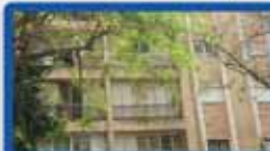
ד.ג 4.5 חדר בנשיאים 115 מ"ר + 115 מ"ר בנטי