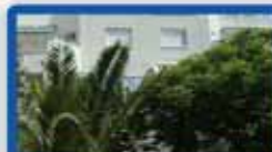
4 חדרים בדגל ראובן 110 מ"ר, חדשה, משמש גדולה