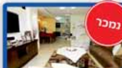
5 חדרים בפנחס חנין 125 מ"ר, קומה ד', משופצת