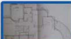
4 חדרים ביטקובסקי פריקט בבניה, 130 מ"ר קומה ב'