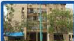
ד.ג 6 חדרים בלוחמי הגטו 280 מ"ר, 40 מ"ר מ.שמש, 2 חניות