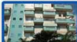
5 חדרים בטרומפלדור 120 מ"ר, מחסן, 2 משמש מושקעת