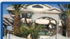
בית פרטי בשמעוני (נוה עוז) 620 מ"ר מגרש, 700 מ"ר