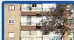
2.5 חדר בטרומפלדור קומת קרקע, עורפית, משופצת