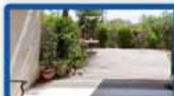
ד.ג 5.5 חדרים בכפר גנים 140 בנטי, 210 גינה עם ריאוף ודק