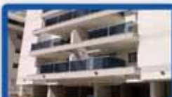
5 חדרים בעצמאות 134 מ"ר, קומה ב', עורפית