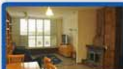
ד.ג 5 חדרים בדגל ראובן 4 חדר לנטה + חדר בנג משופצת