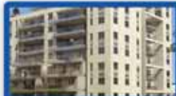
6 חדרים ביטקובסקי פריקט מגרש בפרדס, 160 מ"ר