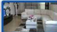
3.5 חדרים בארלוזורוב 105 מ"ר, קומה א', 3 כיווני אויר