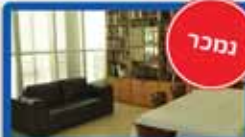
4.5 חדר בדגל ראובן 125 מ"ר, מעלית, חניה