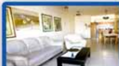
5 חדרים בכפר גנים 143 מ"ר, עורפית, 2 מרפסות