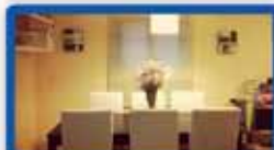
3 חדרים בנשיאים 93 מ"ר, משופצת, 3 כיווני אויר