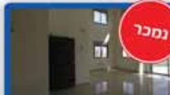
חפלקס 6 חדר ברב אייזנברג 175 מ"ר בנטי, 2 מרפסות, מפואר