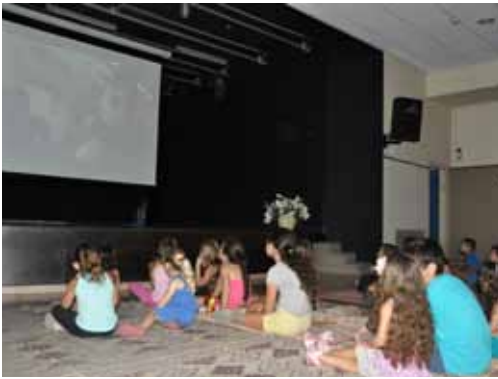
ילדי השכונה צופים בסרט, צילום: דורון קורן

לרגל השנה החדשה, אני מבקש לברך את כל חברי ועדת תרבות המדהימים שלנו, שתרמו רבות ממרצם, מזמנם היקר ומכישרונם, כדי להפיק אירועים רבים לתושבי השכונה. בין היתר הנעימו את חיינו בשכונה בתחרות צילום, בהרצאות ובמופעים שהתקיימו ב"עולמות", בתהלוכת העדלאידע השנתית, במסיבת פורים ובערבי שירה בציבור.