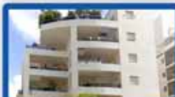
ד.ג 6 חדרים ביוסף נקר 167 מ"ר בנטי, 120 מ"ר גינה