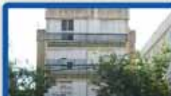
3 חדרים בטרומפלדור ק"א מרווחות מעלית, חניה