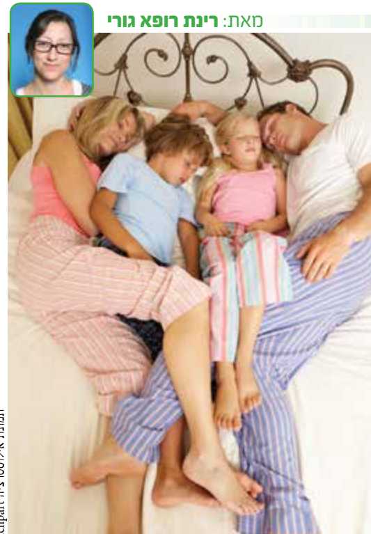
תמונת אילוסטרציה iclipart