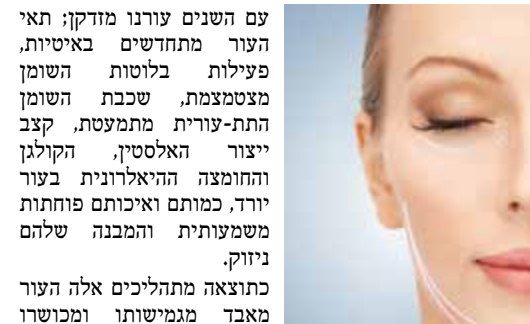
צילום אילוסטריציה depositphotos

עם השנים עורנו מזדקן; תאי העור מתחדשים באיטיות, פעילות בלוטות השומן מצטמצמת, שכבת השומן התת-עורית מתמעטת, קצב ייצור האלסטין, הקולגן והחומצה ההיאלרונית בעור יורד, כמותם ואיכותם פוחתות משמעותית והמבנה שלהם ניווק. כתוצאה מתהליכים אלה העור מאבד מגמישותו ומכוסה לספוג לחות והוא הופך רפוי, דק, יבש ובעל קמטים: קמטים דינאמיים- קמטי הבעה שנובעים מפעילות חוזרת ונשנית של השרירים ומטופלים לרוב בבוטוקס, וקמטים קבועים, שנוצרים מאיבוד נפח בפנים ומטופלים על-ידי הזרקת חומרי מילוי קבועים כמו סיליקון, או חומרי מילוי זמניים כמו חומצה היאלרונית.