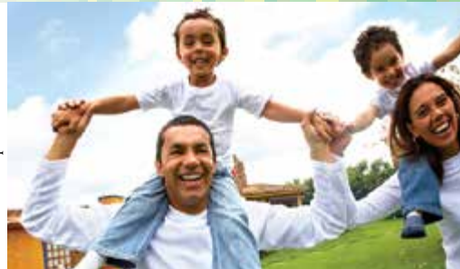
תמונת אילוסטריציה idipart

• מלך הגיונגל - חלקו לילדים שמות של חיות ואפשרו להם לחקות את תנועותיה ואת קולה.