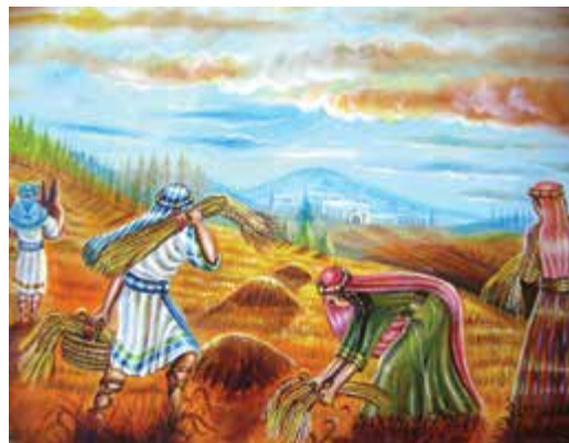
ציורי תנ"ך/ איסוף התבואה בשדה, ציירה: אהובה קליין © (שמן על בד)