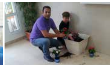
שותלים במח"ד כפר גנים