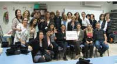
תמונת מחזור בוגרות קורס דירקטוריות פ"ת עם ראש העיר - אפריל 2014

ובאיררה תומכת, הן מודעות לערך המוסף שיש בליווי אישי, בגמישות שתאפשר להן להשלים שיעור שהסירו, הן מצפות להקשבה ולעצה מקצועית, להכוונה לקראת הגשמת הלימודים ומעל הכל לחברותא טובה, וכל אלה לצד "הלהטוט" בין משפחה, קריירה, חיים חברתיים ומשפחתיים. כל זה ועוד מצפה לך ב"יהל".