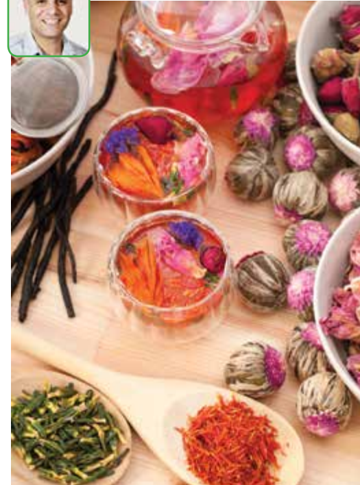
צמחי מרפא ותבלינים. תמונת אילוסטרציה: P.G.

בצמחי מרפא ותבלין שנמצאו בכפר והיו יעילים לטיפול בחיזוק הריאות ולטיפול בדלקות ריאות. בנוסף, שילבתי תזונה תומכת ועיסוי מיוחד. הטיפול ערך מספר ימים והשיפור ניכר לעין. התרגשתי מאוד כשהציעו לי להיות רופא הכפר והבטיחו שישלמו לי בחיות משק ובמוצריהם תמורת הטיפולים. הבעל אף לקח אותי לטיול מדהים לראש הר, כדי שאחזה ב"קבורה טיבטית". המחווה ריגשה אותי ונגעה ללבי, אך לא נשארתי בלנגמוסי והמסכתי במסעי. שנה טובה ובריאה!