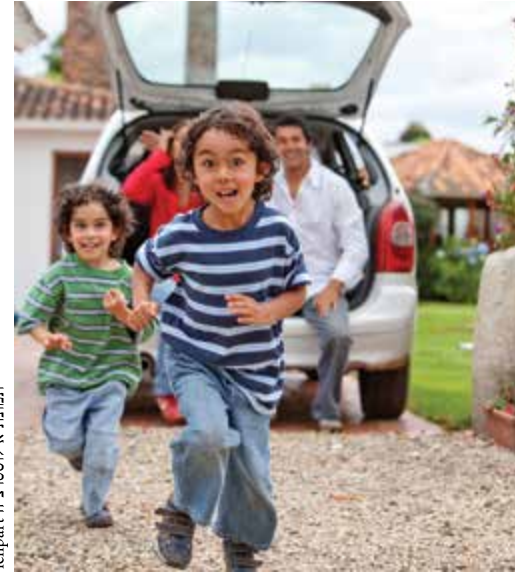
תמונת אילוסטרציה

ההרשמה לחוגים החלה. האם שיבוץ הילד בחוגים רבים מומלץ להעשרתו ולהתפתחותו או שזה בבחינת - תפסת מרובה-לא תפסת? • חוה טופר