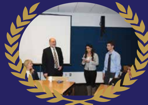
המנהיגים הצעירים מייצגים את מדינת ישראל באו"ם

התלמידים, שיפגינו כישורי מנהיגות במסגרת תהליך המיון, יעברו הכשרה שתכלול סדנאות וסיורים לאורך השנה, וכן יזכו באפשרות לצאת למשלחות לחו"ל.