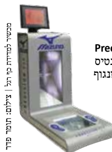
מכשיר למדידת כף הרגל

איך יודעים איזו נעל ספורט תעשה את העבודה הכי טוב? בחנות הספורט החדשה "אטלנטיס", שתיפתח בקריית אריה, מוצב מכשיר Precision Fit, פיתוח מיוחד של המותג מיזונו, שסורק את כף הרגל ומאפשר התאמה מרבית של הנעל לרגלו של הספורטאי. הנבדק עולה על המכשיר בכף רגל יחפה, המכשיר סורק אותה במשך מספר שניות ומציג נתונים אודות כף הרגל- מידה, רוחב, מבנה הקשת וכדומה. הנתונים מאפשרים התאמה מרבית של נעל הספורט למשתמש.