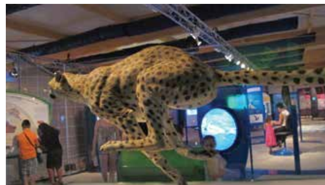
תערוכת "המכונה שבפנים"

תערוכה אינטראקטיבית חדשה לכל המשפחה במוזיאון המדע ע"ש בלומפילד ירושלים • מציגה עד תאריך 18.10.2014