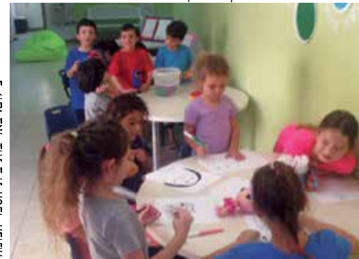
וכבר נהנים מפינות הלמידה המזמינות

בהצלחה לבית-הספר החדש- לתלמידים, להנהלה, לצוות ההוראה ולהנהגת ההורים. אין ספק שהמשך מבטיח, וטומן בחובו הגשמת חלומות ועשייה חינוכית מברוכת. שנה טובה!