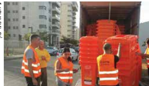
עובדי התברואה מחלקים את הפחים הכתומים. עכשיו אפשר למחור אריות

לפני שנה שלחתם אותי, בוחרתי היקרים, לייצג אתכם במועצת העיר.