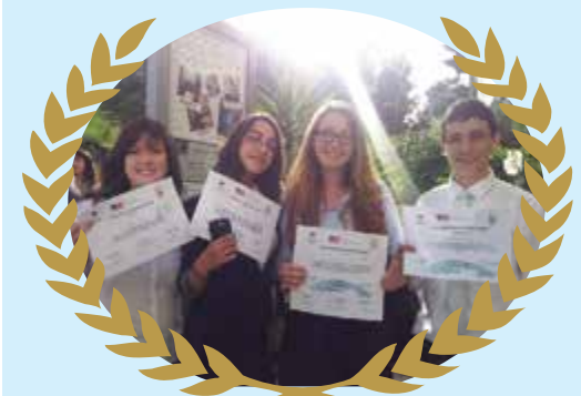
זכיות השגרירים הצעירים במקום הראשון בתחרות מודל האו"ם