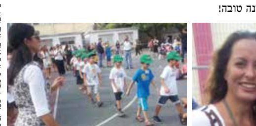
טקס תחילת שנה במח"ד כפר גנים

בהצלחה לבית-הספר החדש- לתלמידים, להנהלה, לצוות ההוראה ולהנהגת ההורים. אין ספק שהמשך מבטיח, וטומן בחובו הגשמת חלומות ועשייה חינוכית מברוכת. שנה טובה!