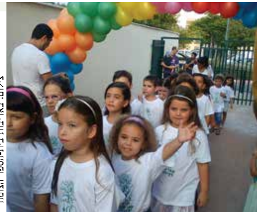
תלמידי כיתות א, מחזור א, נכנסים נרגשים לטקס שנערך בבית-הספר

ב- 1.9.14 התקיים טקס פתיחת שנת הלימודים ובו קבלת פנים מרגשת לתלמידי כיתות א הנרגשים. הטקס היה מושקע וססגוני; ילדי בית-הספר קיבלו כובעים בשלל צבעי לוגו בית-הספר, ובלונים עם משמעות לכל צבע הופרחו אל השמיים.