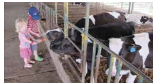
משקים עגלים במשק ברגר

משק ברגר הוא הוא לא עוד פינת ליטוף, אלא משק חקלאי חי ופעיל במשך כל ימות השנה, ובו חווים המבקרים פעילות חקלאית אמיתית ואוטנטית.