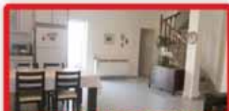
ברח' תדהר כפ"ג ב', דירת גג, 7 חדר, יחידה בקומה! נוף, מעלית