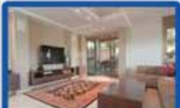
דגן 5.5 חדר' ביסוף נקר 140 מ"ר בנוי, כניסה נפרדת