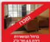
בניחל המשיחה דירת 4.5 חדר 27