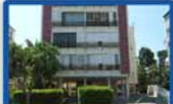
3.5 חדרים בארלזחוב 105 מ"ר, קומה א', 3 כיווני אויר