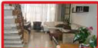
ברח' שד"ר דירת גג 4 חדר 37 שקטה, פונה לגינה, זכויות בניה, נוף!