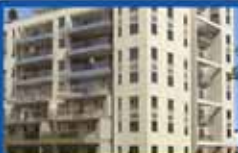
6 חדרים ביטקובסקי פרויקט מנרב בפרדס, 160 מ"ר