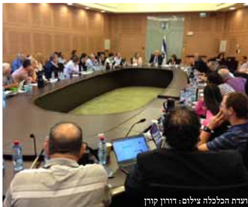
ועדת הכלכלה