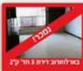
באר לוזרוב דירת 3 חדר 27