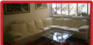
ברח' בן יהודה דירת 6 חדר 17, 4 כ"א מעלית וחניה