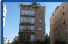
4.5 חדר' בדגל ראובן 125 מ"ר, מעלית, חניה