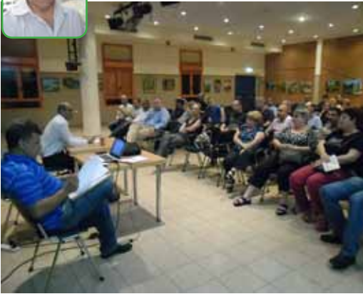
אסיפת ועדי הבתים.