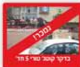
בדקו קוטל טווי 5 חדר