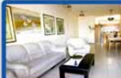
5 חדרים בבן גוריון 143 מ"ר, עורפית, 2 מרפסות