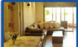
5 חדרים במסקין קומה ג', מושקעת ביותר