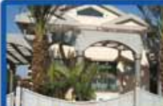
בית פרטי בשמעוני (נוה עוז) 620 מ"ר מגרש, 700 מ"ר