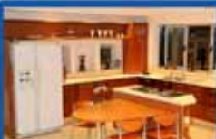
קוטג' 8 חדרים ברפאל רייס 350 בנוי, 250 מגרש