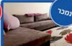
3 חדרים במיזנר 90 מ"ר, מרווחת, מושקעת