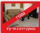
במסקין דירת 3 חדר 37