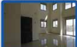
חפלקס 6 חדר ברב אייערבך 175 מ"ר בנוי, 2 מרפסות, מפואר