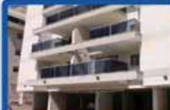
5 חדרים בעצמאות 134 מ"ר, קומה ב', עורפית