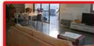
ברח' פנחס חגין דופלקס 6 חדר 3 מ"ש, נוף למערב וצפון, מחסן