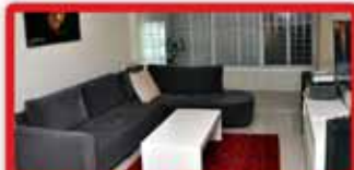
ברח' חיים כהן דירת 3 חדר 37 ללא, משופצת מהיסוד, חניה