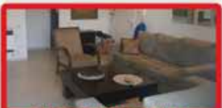
ברח' יטקובסקי 3 חדר 37 מסודרת, מ"ש סוכה, מעלית