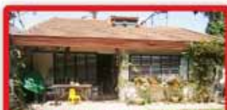
בנווה עוז הוותיקה ברח' הזית דו משפחתי 120/320 זכויות בניה!