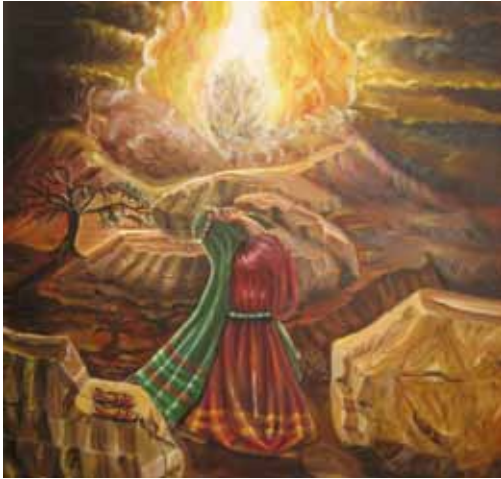
ציורי תנ"ך/ משה והסנה ציירה: אהובה קליין © (שמן על בד)

אומנות ברוח ה' מעצימה את קדושת בית התפילה