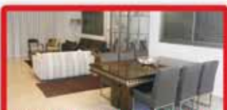
ברח' מסקין פנטהאוז ענק וייחודי 2 כניסות, 3 מ"ש, 200 מ"ר בנוי!