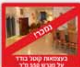
בשפוחות קוטל גבול על מני 550 מ"ר

להמלצות - כנסו לאתרנו www.nadlankfarganim.co.il