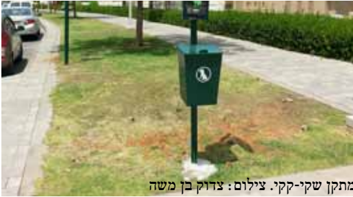
מתקן שקי-קקי.