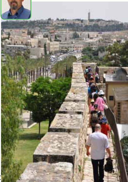
טיול על חומות ירושלים