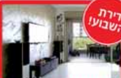
4 חדרים ביגאל מוסימון 120 מ"ר, משמש 20 מ"ר