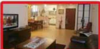
ברח' כץ דירת 4 חדר ענקית, 47, משופצת מהיסוד, יח' הורים