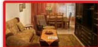
ברח' סלומון דירת 3 חדר 47, 90 מ"ר