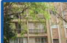
דגן 4.5 חדר' במשיאם 115 מ"ר + 115 מ"ר נג