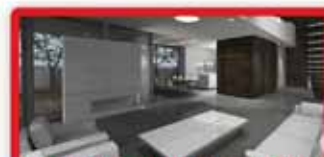
ברח' קידר דו משפחתי מפואר יח' דיור ענקית, מיקום מוקדש!