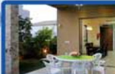
קוטג' 7.5 חדרים בעמטאל לויס 300 מ"ר בנוי, 250 מ"ר מגרש