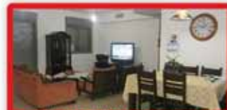
ברח' קפלנסקי 5.5 חדר 57 מ"ש 25 מ"ר, נוף פתוח, מחסן