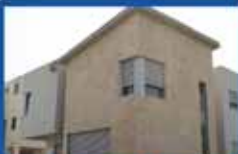
קוטג' חדש בניגס (כת גנים) 310 מ"ר מגרש, 280 מ"ר בנוי