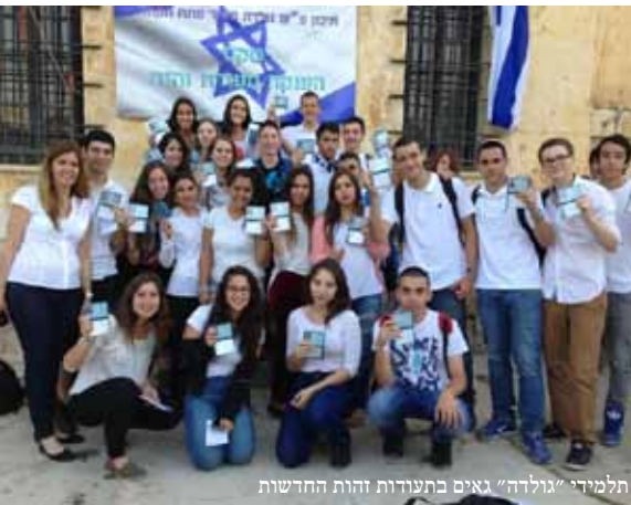
תלמידי "גולדה" גאים בתעודות זהות החדשות