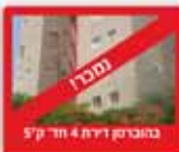
במורכב דירת 4 חדר 57