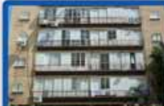
4 חדרים ביסמין 115 מ"ר, עורפית, מעלית חניה