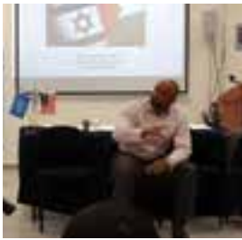
ד"ר קית נובל דובר השגרירות האמריקאית

רגע לפני הבחירות הוזמנו נציגים מרחבי הקשת הפוליטית לבית-הספר לשגרירים צעירים, כדי להציג את משנתם בפאנל בחירות מרתק. מטרת הפאנל הייתה לחשוף את התלמידים, צמאי הידע, למערכת הבחירות ולדעות השונות, ולעורר את מעורבותם החברתית לפני שיצביעו לראשונה לכנסת ישראל. את הפאנל המכובד הנחה מר אדי אהרונוף, עורך חדשות בערוץ 1.