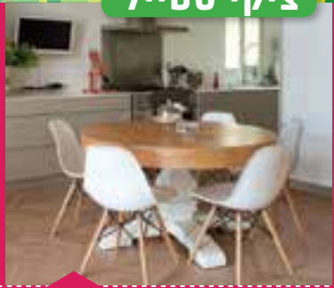
שולחן עגול מעץ במרכז המטבח