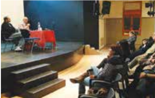
כנס תח"צ | צילום: דורון קורין

הכנס שאורגן על-ידי צביקה שטרן, חבר ועד כפר גנים ג, אירח את אסי סוזנה ממונה תח"צ במשרד התחבורה מחוז מרכז, ואת אבשלום שמחי ממונה תח"צ פתח-תקווה.