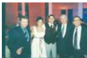
בחתונת בתו עם שמעון פרס ומאיר שטרית