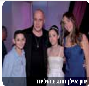
ירון אילן חוגג בהוליווד