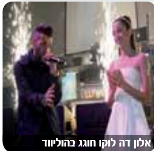
אלון דה לוקו חוגג בהוליווד