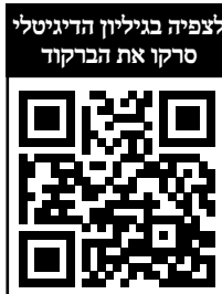
לצפייה בגיליון הדיגיטלי סרקו את הברקוד