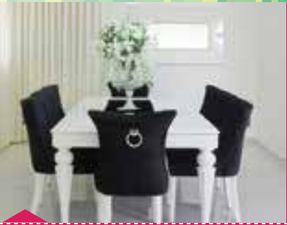
שולחן לבן מלבני מוקף קרניזי תאורה