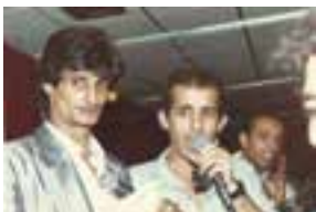
עם זוהר ארגוב

"בכלל לא מתסכל. דרכי הייתה סוגה בשושנים על אף ניסיונות התקשורת להחביא אותי ואת היצירה שלי, כי הקהל אהב אותי. 20 שנה כתבתי ואו נהייתי גם זמר. ההופעה הראשונה שלי הייתה הופעת יחיד באולם של 700 איש ומיד חובקתי על-די הקהל. בשנה הראשונה עשיתי 130 הופעות. זה לא מובן מאילן. הופעה אחת בערוץ טלוויזיה זה לא מבחן שבביל זמר לאורך זמן. המבחן שלו יהיה בכך שייצור לעצמו את התוצרת הייחודית לוי".