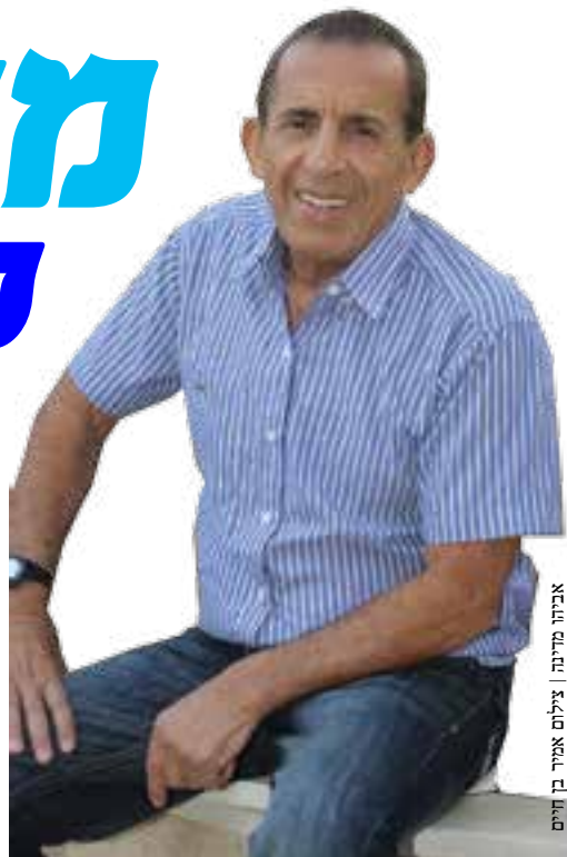
אביהו מדינה

מדינה נולד בשכונת שבזי בתל-אביב וגדל בחולון. בנערותו התחנך בקיבוץ כיסופים, בצבא שירת בחיל השריון כמפקד טנק ולחם בכמה ממלחמות ישראל.