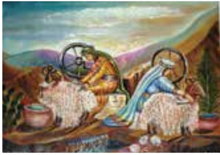
ציור תנ"ך/ הנשים טוות חוטים למשכן/ ציירה אהובה קליין © (שקן על בד)

התורה מרוממת ומאדירה את כבוד האישה ומעריכה את חכמתה ואת תרומתה לגאולה