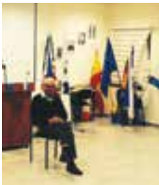
דניאל שק, לשעבר שגריר ישראל בצרפת