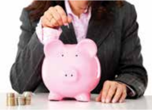
תמונת אילוסטרציה iclipart

ואינו תלוי בנדיבותו של אדם אחר, למשל, אם יהיה לו נכס שמגביע סכום קבוע שערכו אינו נשחק עם הזמן. מי שמחזיק, נניה, בארבע דירות שמניבות הכנסה חודשית של 15 אלף ש"ח יכול לחוש עצמאות כלכלית, בתנאי שהוא לא חייב להחזיר כנגדן הלוואות גדולות ושחשבון ההוצאות שלו תואם את ההכנסות. לחילופין, מי שמחזיק תיק ניירות ערך בשווי של 4 מיליון ש"ח, שמייצר לו תשואה של 4% בשנה, השקולה להכנסה ברוטו של כ- 160 אלף שקל בשנה, גם הוא יכול להרגיש עצמאות כלכלית.