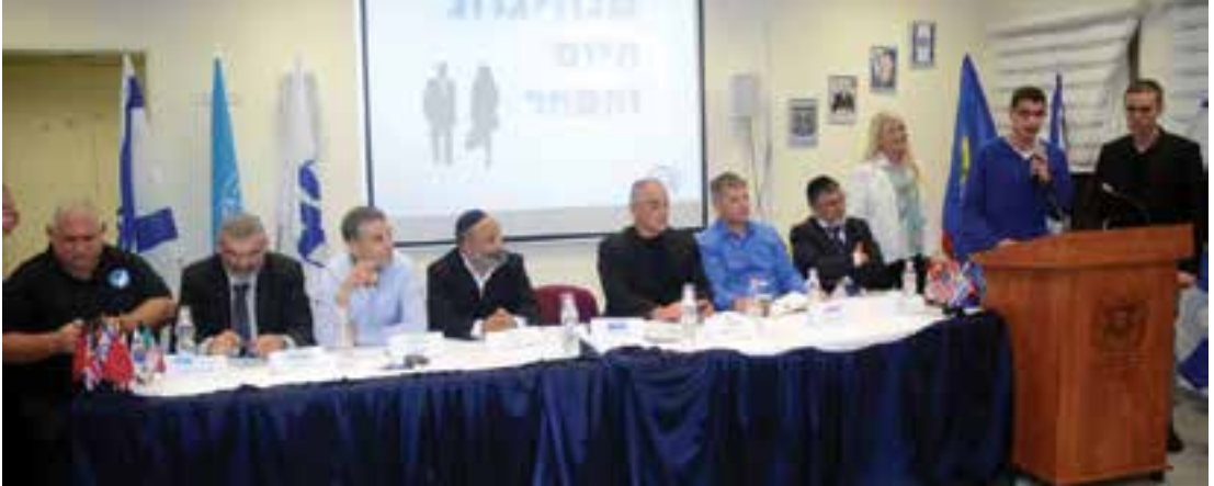
פאנל הבחירות

אירוע רודף אירוע בבית-הספר לשגרירים צעירים, והתלמידים רוכשים ידע על הדיפלומטיה הבינלאומית כמו גם על הפוליטיקה הארצית • אילת שדה