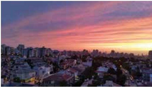
שכונת כפר גנים