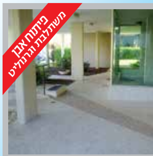
פיתוח אבן משתלבת ונדידה