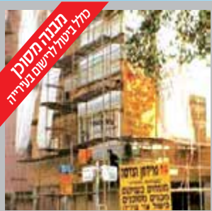
מתחם מסוכן כלל ביטול לרישום בנדידה

פרידמן הנדסה מעסיקה צוות עובדים גדול ומיומן, כאשר עבודותיה מתוכננות ומפוקחות עד המפתח, ע"י אדריכלים ומהנדסים מהשורה הראשונה