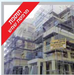
תוספות מרכיבי שטח

חב' להנדסה ואדריכלות בנין רישיון מס' 35714