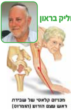
מכניס קלאסי של עבדית ראש נצמם הזרוע (הומרוס)