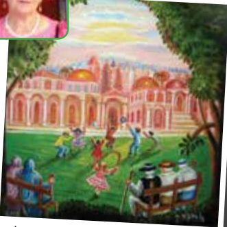
ציור תנ"ך/ נבואת הנביא זכריה על ירושלים ציירה אהובה קליין © (שמן על בד)

כנורותינו: כי שם שאלונו שובינו דברי שיר ותוללנו שמחה, שיר לנו משיר ציון: איך נשיר את שיר- ה', על אדמת ניכר... השובים בבבל ביקשו מהיהודים שישירו משירי ציון, מתוך לעג לגולים, אך היהודים בכאבם, סירבו לעשות כן, בטענה שאינם מסוגלים לשיר על אדמת ניכר הם נשבעו: "אם אשכחך ירושלים, תשכח ימיני: תדבק לשוני לחכי אם לא אוכרכי, אם לא אעלה את ירושלים על ראש שמחתי".