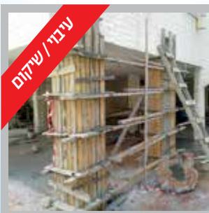
עיבוד / שיקום