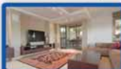
דגן 5.5 חדר ביוסף נקר 140 מ"ר בניי, כניסה נפרדת