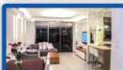
5 חדרים במסקין 130 מ"ר, קומה ג, מ.סוכר, מחסן