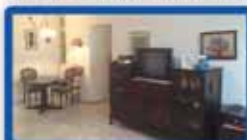
3 חדרים בדגל ראובן 80 מ"ר, קומה א, מרווחת