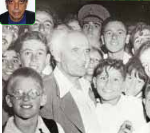
ראש הממשלה בכנס נוער בתחילת שנות החמישים