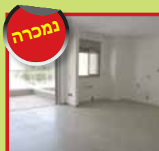
דירת 5 חד' ק.2 ביטקובסקי חדשה+2 חניות ומחסן