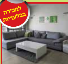
5.5 חד', ק.3 בחיים זכאי, מרפסת 24 מ"ר, סוכה, מחסן צמוד ו-2 חניות