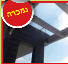
דירת 5 חד' ק.5 ביטקובסקי חדשה עם מ.סוכה, 2 חניות