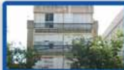
3 חדרים בטורמפלדור ק"א, מרווחת, מעלית, חניה