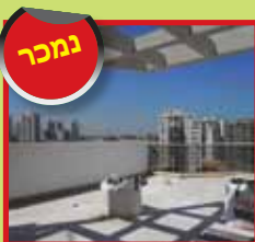
פנטהאוז 6 חד' חדש ברח' נקר מרפסת 60 מ"ר+מחסן