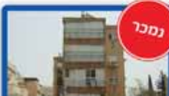
4 חדרים בלוחמי הגטו קומה ד', אפשרות לתוספת חדר