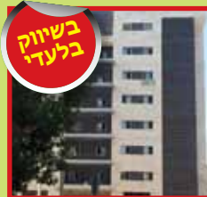
דירות 6,5 חד', מיני פנטהאוז ביטקובסקי חדשות וממוגות+2 חניות ומחסן. אכלוס מידי