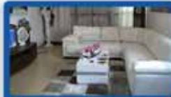
3.5 חדרים בארלזרוב 105 מ"ר, קומה א', 3 כינוני אויר