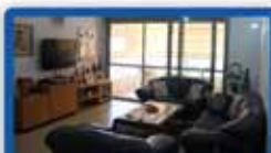
4 חדרים בלוחמי הגטו (מגרב) קומה 6 בניין חדש, מ.שמש