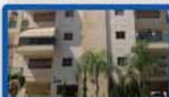
5 חדרים במסקין 135 מ"ר, קומה ד, מחסן, 2 חניות