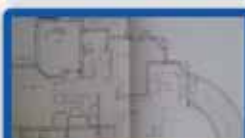
4 חדרים ביטקובסקי פריקט בבניה, 130 מ"ר קומה ב'