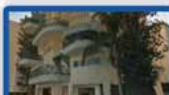
4 חדרים ביטקובסקי 100 מ"ר, מעלית חניה, מ.שמש