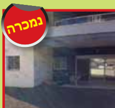
ד.גן 6 חד' חדשה ברח' יטקובסקי גינה 250 מ"ר