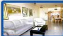
5 חדרים בכפר גנים 143 מ"ר, עורפית, 2 מרפסות