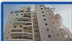
4 חדרים בעצמאות קומה ד, 103 מ"ר