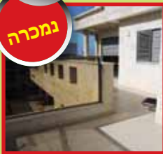
פנטהאוז 5 חד' ק.6 ביטקובסקי עם מרפסת 60 מ"ר