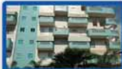
5 חדרים בטורמפלדור 120 מ"ר, מחסן, 2 מ.שמש, מושקעת