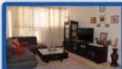
4 חדרים בדב הוז קומה כ, 100 מ"ר, משופצת מהיטוד