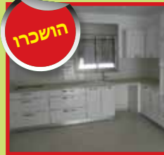
3 דירות 5 חד' ביוסף נקר חדשות כולל מחסן ו-2 חניות