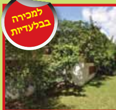
דירת גן 4 חדרים מרווחת במיינר גינה מטופחת 100 מ"ר+מחסן ו-2 חניות