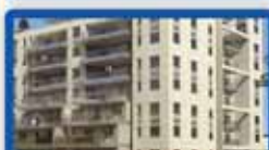
6 חדרים ביטקובסקי פריקט מגרב בפרדס, 160 מ"ר