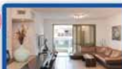
דירת 5 חדר בבניה, 125 מ"ר, ק 5 סלון וסטבה מרווחים, 2 חניות