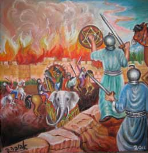
ציור תנ"ך/מלחמת המכבים נגד היוונים ציירה: אהובה קליין © (שמן על בד)

מתי אין לנו מנוס אלא להגן על עצמנו, ומי הוא הגיבור האמתי?