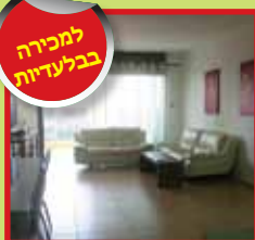
5 חד', ק.5 בנקר הגבוה, מרווחת ומארת, נוף פתוח+מחסן ו-2 חניות