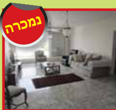
ד.גג 4 חד' ברח' זליג בס כולל גג 120 מ"ר ו-2 חניות