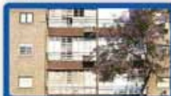
2.5 חדר בטורמפלדור קומת קרקע, עורפית, משופצת