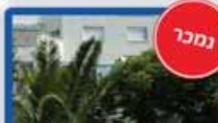
4 חדרים בדגל ראובן 110 מ"ר, חדישה, מ.שמש גדולה