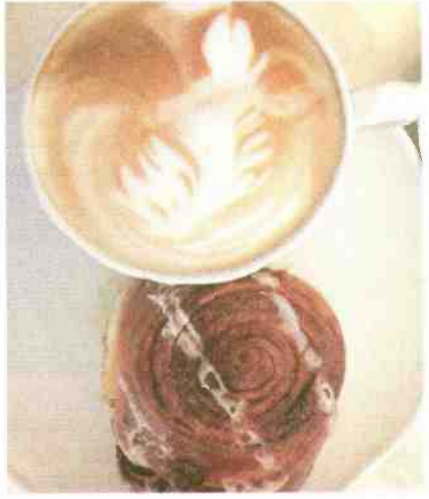
אי אפשר להפסיק. עמק רפאים בירושלים