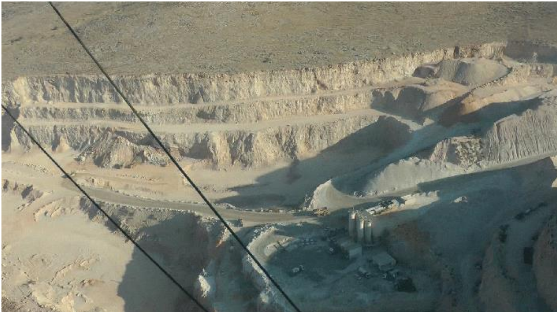
המחצבה מול ניל"י

גם באתר זה, כביתר האתרים הנאטופיים, עיקר המגורים היה בחוץ, והמערה, גדולה ככל שהייתה, שמשה כמחסה סלע בלבד. גודל האתר, שהוא בין הגדולים באתרים הנאטופיים בארץ, מאפשר להעריך כי התגוררו בו בזמן התקופה הנדונה, בקבוצה אחת מלוכדת, עשרות רבות של בני-אדם. הוא היה פעיל וחולק לאזורי משנה ממושטרים. המקום ניתן להגנה בקלות על ידי יושביו, שהתגוררו באזור הטרסות שבחזית המערה והן במערה עצמה. הנתון המעניין והחשוב הוא שבני אדם רבים התגוררו באתר רב-דורי זה. היה זה נוף "בראשיתי" וככזה הוא נשאר עד תקופתנו. גם היום זהו אחד האזורים הבודדים בארץ שעדיין נראים בו צבאים רבים, צבועים, תנים וציפורים רבות כבימי קדם. במקום נמצאה גלריית חי וצומח האופיינית בחלקה לתקופה, אשר מהם התקיימו הנאטופים.