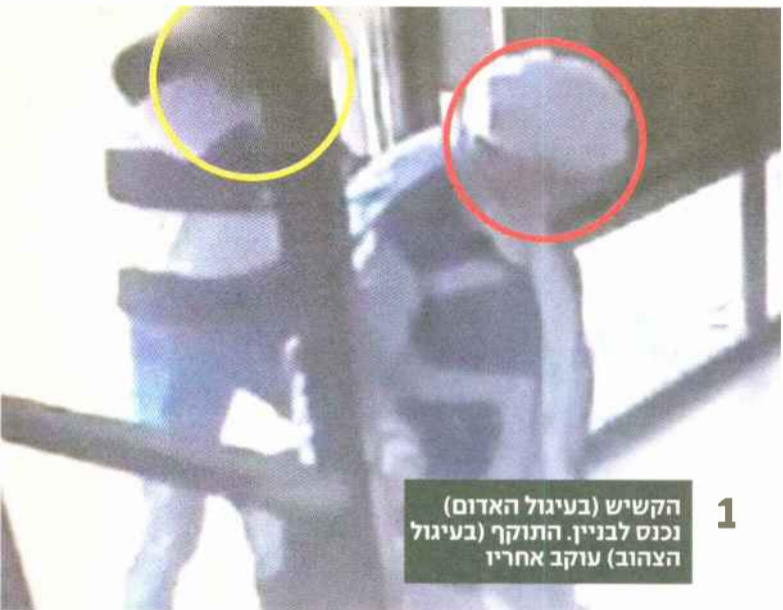
1 הקשיש (בעיגול האדום) נכנס לבניין. התוקף (בעיגול הצהוב) עוקב אחריו

מועילה בהרתעת הרבים מפני ביצועה. (השופט המחוזי אליהו ביתן בגזר דין שניתן במארכ 2015).