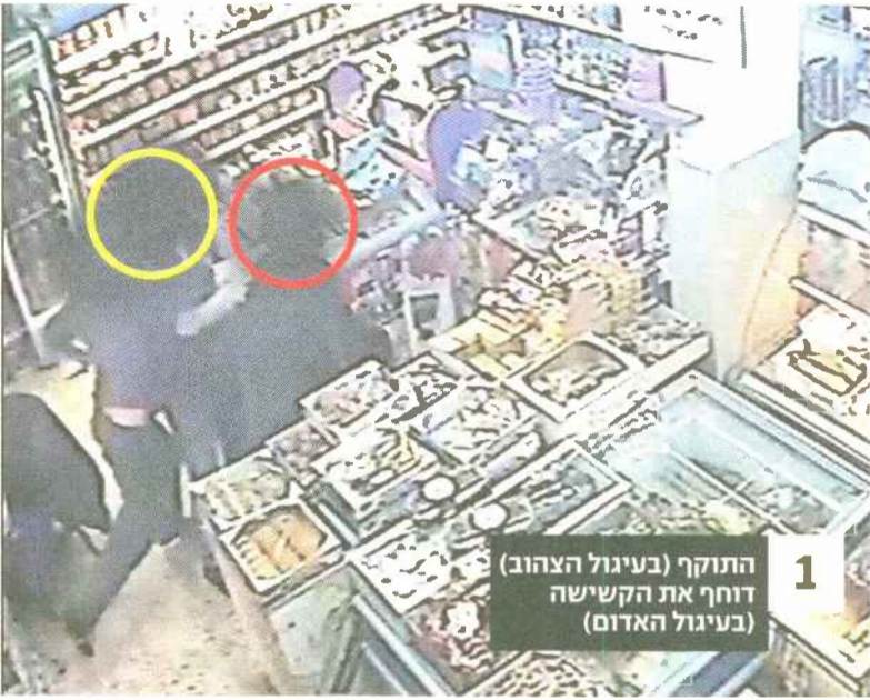
1 התוקף (בעיגול הצהוב) דוחף את הקשישה (בעיגול האדום)