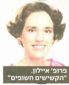
פרופ' איילון. "הקשישים חשופים"