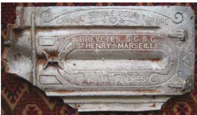
הכיתוב על תחתית רעף מרסיי טיפוסי לארץ ישראל במאה ה-19