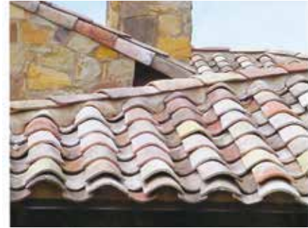
בית ברומא. טקסטורה כללית של גג

לפליאת בעלי המלאכה המקומיים. המוצרים הללו שימשו לבניית הגשרים, מעבירי המים, והמנהרות הגדולות של הפרויקט. באותה תקופה נחפרה "תעלת מרסיי" - מיזם ממלכתי אדיר מימדים שחיבר את כל המחוז, דרך נהרות האזור, אל העיר הגדולה שבדרומו (-1849) גם מיזם זה צרך כמויות גדולות של מוצרי חרסית עבור צנרת ניקוז, תעלות, מבנים וגשרים, וכך התפתחה והשתכללה במהירות תעשיית החרסית בעורף העיר.