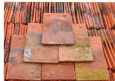
שיעור החפיפה הגבוה של רעפים שטוחים. צולם במחסן עתיקות, אנגליה