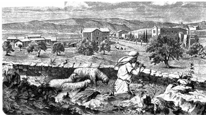
הבתים הוותיקים של ראשוני הטמפלרים הינם שטוחי הגג לעומת המבנים החדשים נושאי הרעפים.