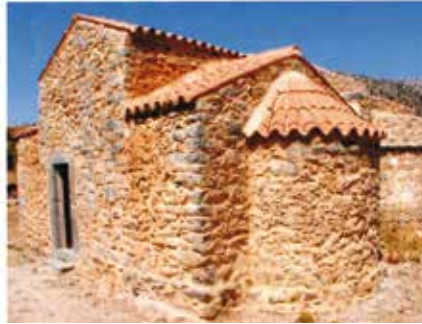
כנסייה כפרית בכרתים. שימושי המגוונים של הרעף העגול