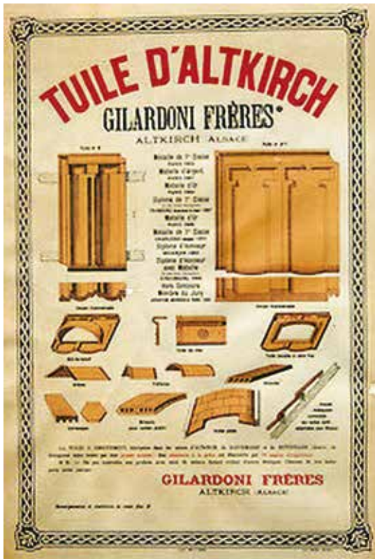
רעף אלטקירש' בכרזה בשפה הצרפתית