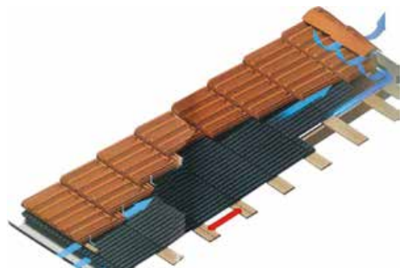
החפיפה המינימלית בין הרעפים. מתוך קטלוג מודרני