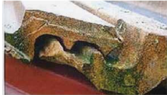
הפטנט של חריצי החפיפה המשתלבים