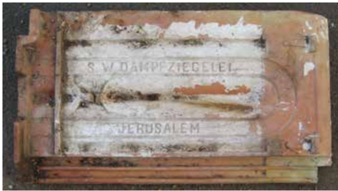
הכתובת האופיינית בתחתית רעף שנלר. גב הרעף היה חלק וללא עיטורים