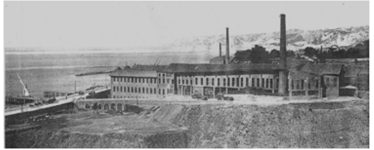
בית החרושת של "האחים רו" (Roux) על שפת הים. מסילות ברזל ומזחים שמאל.

הספר החקלאי צרפתי של אליאנס, השתמש בהם. הופעתם אז הייתה עדיין מצומצמת כיוון שחסרו הידע הטכנולוגי, המשאבים, וסיבה מוצדקת לאימוצם הגורף. השינוי התחולל בחורף 1874-1875, עת פגע גל קור חסר תקדים באגן המזרחי של הים התיכון. הטמפרטורה צנחה באופן קיצוני, וגשמים כבדים, מכות ברד, כפור, ושלג פגעו בארץ ישראל לחודשים ארוכים. נזקים עצומים נגרמו לרכוש, עשרות בתים התמוטטו, מאות נסדקו, ולא לה ששרדו חדרו מים. המהלומה של חורף חריג זה דחפה בבת אחת למרכז הבמה את גג הרעפים המשופע, קל המשקל והאטום, כפתרון האידיאלי לכל אלה.