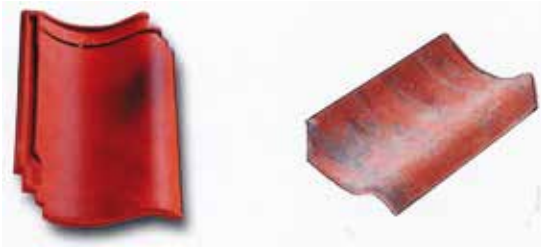
מהדורותיו החדשניות אימצו את רעיון נעילת שוליים מרעף מרסיי (pantile באנגלית). מימין: רעף ישן. משמאל: רעף חדש