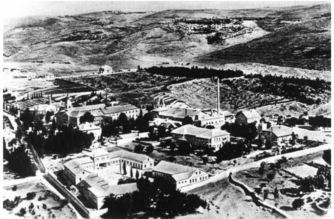
מתחם בית היתומים הסורי בירושלים: ארובת בית החרושת הגבוהה בולטת למרחוק. חלק ניכר של המפעל סמוקם כמורד הגבעה ונסתר מהתמונה (1930). מקור:

H. Schneller Mein Herz. freut sich, das du so gerne hilfst, 19 Khirber Kanafar, 1960, p.18