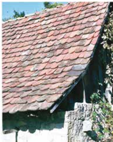
גג של בית כפרי ליד באזל, שוויצריה. בעל שוליים עגולים