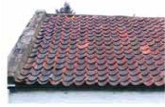
רעף בעל חתך רוחב דמוי האות S. מוכר בהולנד וסקוטלנד מאז המאה ה-17. מקנה לגג טקסטורה של גלי ים