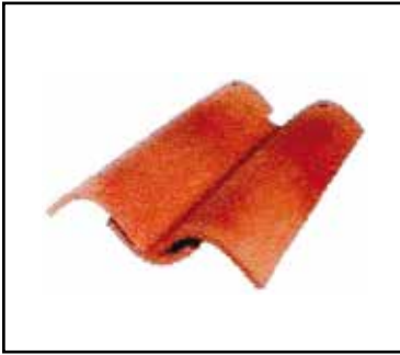
טקסטורת רעף עגול