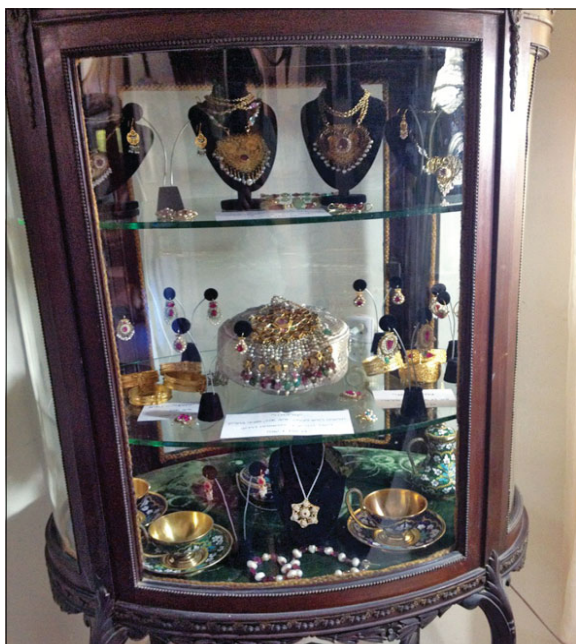
תכשיטים וכוסות קידוש

אנו מלאי תקווה שהתערוכה תוצג מחדש בפני הציבור לתקופה ארוכה יותר.