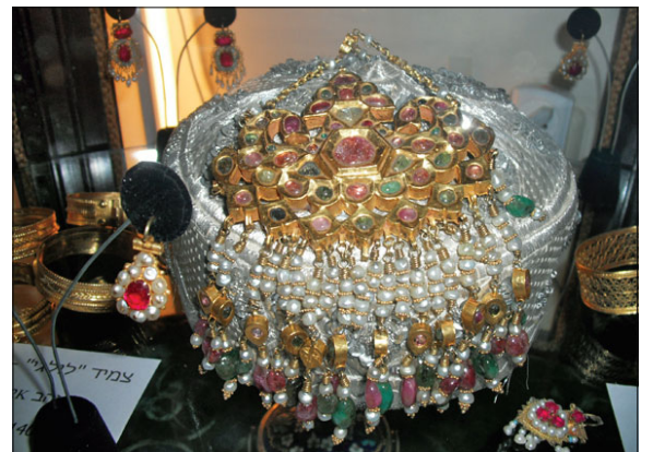
כובע וקישוטי כלה

אזכיר גם את אבי המגיע בהתרוממות רוח מכות-הכנסת ונכנס בברכת "שבות שלום". אמי, שסיימה את ההכנות לשבת מבעוד יום, ברכה על נרות השבת ונגשה והצמידה את ידיה למוזהו שבפתח הסלון, מלמלה