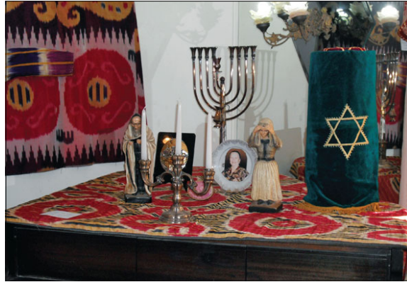
הדלקת נרות שבת