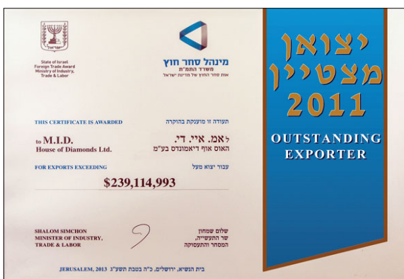
תעודת "יצואן מצטיין 2011"