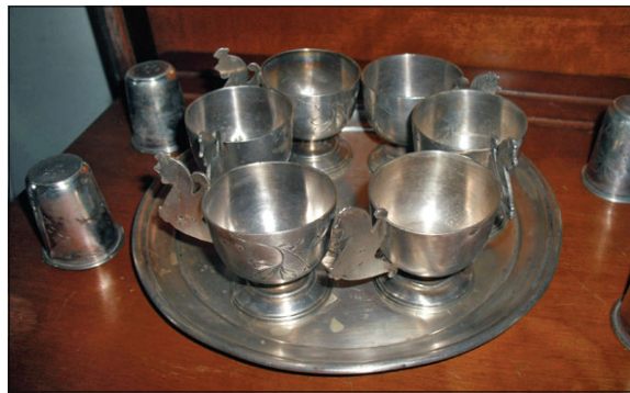
כוסיות עראק על לעלי (מגש)

הינה כי כן רבות, באמתחתנו תרבות בוכרית מפוארת כפי שאנו רואים באוסף הזה האוטנטי, המרגש, המוכיר נשכחות. אנו יכולים להיות גאים בו. אני גאה בבעלי הבית שושן וחייקה יצחק, שהגדילו לעשות באוסף המפואר הזה, שראוי הוא בהחלט להיות מוצג במוזיאון, ובכוננת, יקריי שושן וחייקה, "להחריים" את המוצגים האלה לתצוגה במוזיאון עתידי, שינציח לדורי דורות את שמכם הנכבד, כאספני המוצגים".