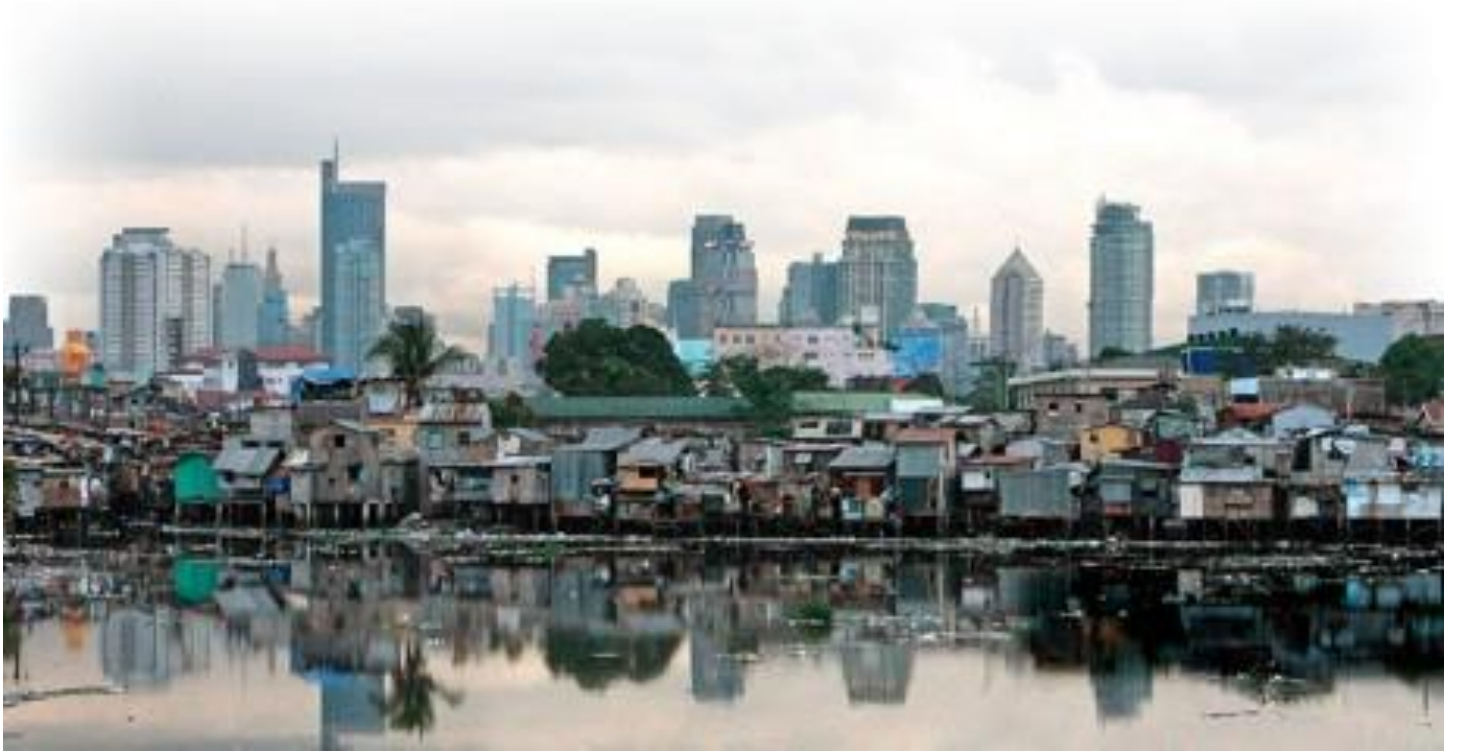
בתי הסלאמס בפיליפינים - דוגמא למגורים של "אזרחות מרדנית" - שמהווים הפרעה להיסטוריה הסדורה בעיר.