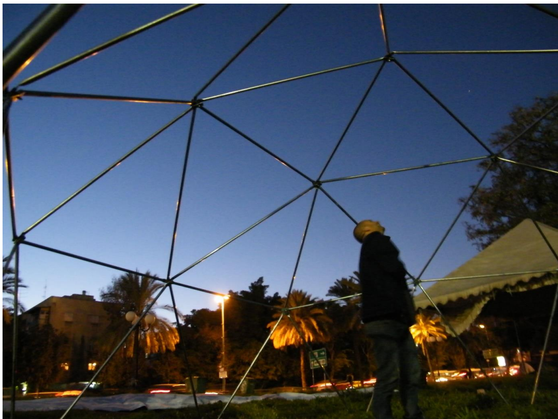
כיפות גיאודזיות במאהל ארלזורוב בתל אביב 2013 - ניסיונות בדיור עצמי על קרקע ציבורית.