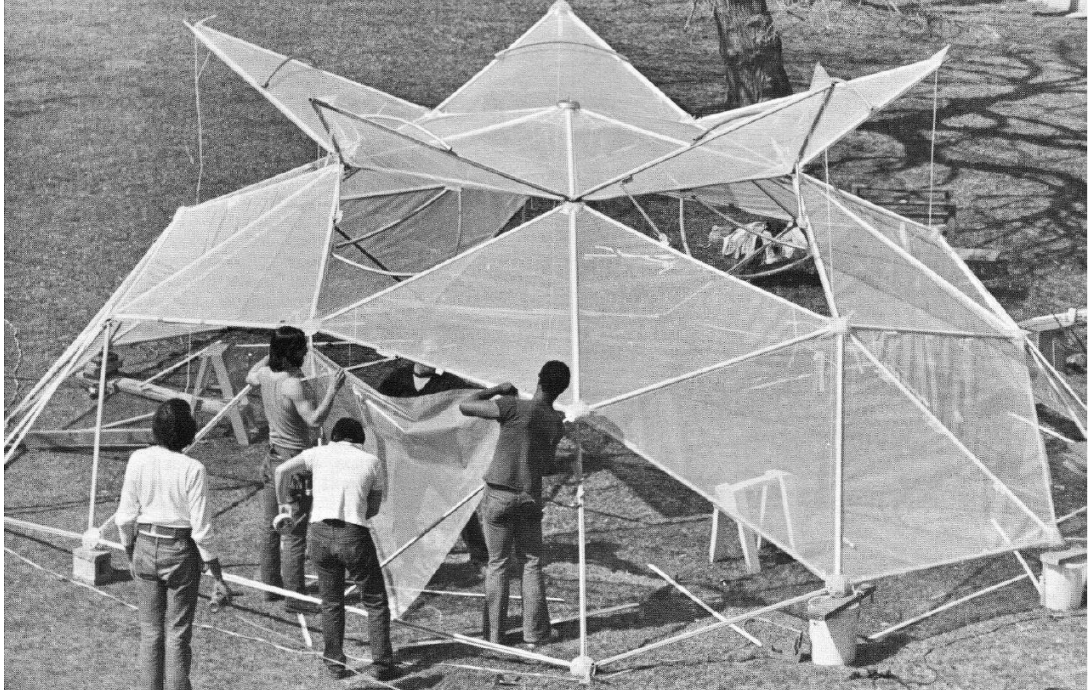
כיפות גיאודזיות בארצות הברית בשנות ה-60 - ניסיונות אוטופיסטים על קרקע פרטית, מתוך חיפוש אחר צורות מגורים חדשות.

נוסף לכך, יש לתת את הדעת לכך, שאם אכן יבחרו הפעילים ללכת בנתיב של הסתמכות על פילנתרופ, ייתכן כי הם יאבדו את התוקף הפוליטי של טענותיהם הראשונות לזכות לדיור מתוקף אזרחותם במדינה, או מתוקף השתייכותם אל העיר.