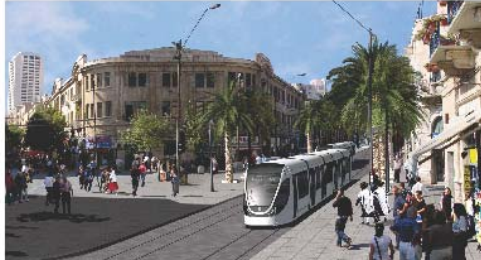
התמונה מראה את המראה החדש של הרחוב

7 מר בירושלים - לב הפועם של העולם סוף נחשב, לפטנת שאופיות של רבים מאתנו. לנשום את אויר הרים ולהריח את ניחוח האורנים, לפטע בין הווה לעבר, לצאת נשבת בבוקר מהבית לצעדה קלה ולמצא עצמך בין החוות. החלום הזה, שפעם היה נחלם של דיירי משכנת שאבנים, מקייל וטלביה הופך בימים אלו למציאות אפשרית גם בעורבו: בין אם אבנח ירושלים הרבים בשכונת החדשות המרחקות, תשבי חוץ או תושבים הימים מחוץ לירושלים - מכל לחזור לשרושים ולהשקע בלב הבירה. קפיצה קטנה לעיר תוכיח שירושלים מחדשת את מוסכה בנחישות ותחשוף את נולת הסמרת של ההחלף המבוקר 7 KOOK ST. של "אפריקה ישראל מגורים", פרויקט מגורים חדש המהווה הזדמנות מצית לזמנים חוקים בלב העיר, בלב תוך טיים, לזית רוב קוק ההיסטורי ולמדרחוב בן יהודה השוקק. כ-35% מדירות המוקיט סטולו 120 דירות יוקרה בנות שניים עד תשעה חדרים כבר נמכרו לקחי איכות ומטמן המארץ ומתויל עוד טרם תחלה הבנייה. עבודה זו מספחה שיש מי שהקדיש להות את כל היתנות.