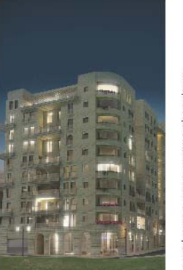
התמונה מראה את המראה החדש של הרחוב

הדירות עצמן נחלת ומאורחת במיוחד. המטבח והסלון נדחלים, שוטפי אור נאוויר. דירות שני חדרים בפרויקט הוקן בשטח של כ-71 - 66 מ"ר נטו, דירות שלוש חדרים הוקן בשטח של כ-118 - 109 מ"ר נטו, נבדלן של דירות ארבעה וחמשה חדרים ינע בין 131 ל-174 מ"ר. הדירות יינחו מחלסת כסלים, ענקיים, דמוי-דלת, שייפתחו מצד אחד אל האסאטו ומצד שני אל הנוף המרהים.