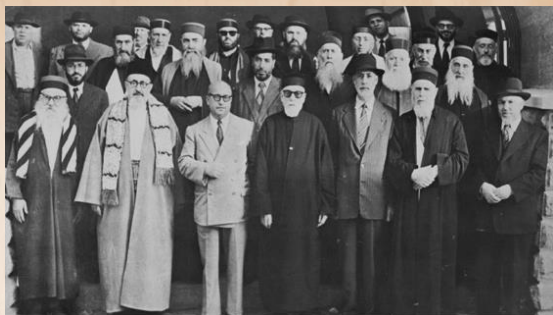
מועצת הרבנים במרוקו – באסיפה השנייה בשנת תש"ט (1949)

"עניין ראש חודש אלול תתחיל לקום באשמרותיך, לומר סליחותיך כי הוא מסוגל לתשובתך, וגם בו ימחלו לך כל עוונותיך, ותבכה ותתחנן אולי יראה ה' בעונייך, וימחה האל דמעה מפניך, כי כל השערים ננעלו חוץ משערי דמעותיך. ואחר הסליחות תקרא תיקון חצות לילך כמו שעושים אנשי אמת אנשים חסידים, ושוב אל מלך ישראל אולי יחיה את נפשך ונפש עבדיך, אלה חמושים בפניך והתענה בו שני וחמישי קודם שיבוא ראש השנה ובו תחפש ותפשפש במעשיך" (רבי שלמה אדהאן, 'בנאות דשא', נד).