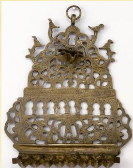
חנוכה, מרוקו, המאה ה"ח. במרוקו הדליקו בשמן בלבד.

צריכה. כגון בהלכות ברכות השחר (או"ח, סימן ו, ד) שפסק: "יש נוהגין שאחר שברך אחד ברכת השחר וענו אחריו אמן, חוזר אחד מהעונים אמן ומברך, ועונים אחריו אמן. וכסדר הזה עושין כל אותם שענו אמן תחילה, ואין לערער עליהם ולומר שכבר יצאו באמן שענו תחילה. מפני שהמברך אינו מכוין להוציא אחרים, ואפילו אם היה המברך מכוין להוציא אחרים הם מכוונים שלא לצאת בברכתו". וכן לעניין ברכת המזון כתב השו"ע (קפג, ז): "בכונן הדבר שכל אחד מהמסובין יאמר בלחש עם המברך כל ברכה וברכה ואפילו החתימות". וכן פסק מרן בהלכות קריאת שמע (טז, ד): "ברכת יוצר וערבית אומר עם השליח ציבור בנחת" (והיינו שאין אומרים שזו ברכה שאינה צריכה, שהרי יכול לצאת בברכות השליח ציבור). ואם כן ישנה סתירה בדברי מרן, שכאן כתב שאדם יכול לכונן שלא לצאת בברכת חבירו וכך יוכל לברך בעצמו, אך לגבי נר חנוכה כתב (תרעז, ג): "יש אומרים שאף על פי שמדליקין עליו תוך ביתו, אם הוא במקום שאין בו ישראל, מדליק בברכתו". ומשמע מדבריו שמי שאינו בביתו, ואשתו הדליקה, אינו יכול עוד להדליק בברכה בשום מקום, אם הוא נמצא במקום של יהודים ולא יועיל אף אם יתכוין שלא לצאת ידי חובה בברכתו.