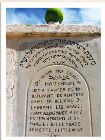
מצבת הצדקת סוליקא חגוואל ע"ה, שכדוגמת יהודית בת בארי, היתה סמל ומופת למסירות נפש.

גם כן הזהר בני בחברך שעשה עמך טובה, עשה עמו טובות הרבה, שלא תהיה כפוי טובה, ואפילו מי שקדמך בעדשים תעשה לו פטומים. ואפילו עשה לך שום אדם רעה, עשה עמו טובה ולמוד ממה שעשה שמעי לדוד המלך [שקללו קללה נמרצת] ונתחייב מיתה, ואפילו הכי אמר [דוד] הניחו לו ויקלל כי אמר לו ה', ושילם לו טובה תחת רעה.