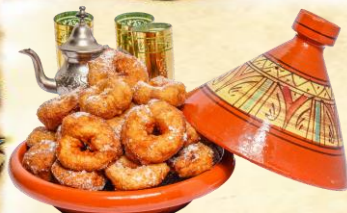
פיג'א – סופגניות מרוקאיות