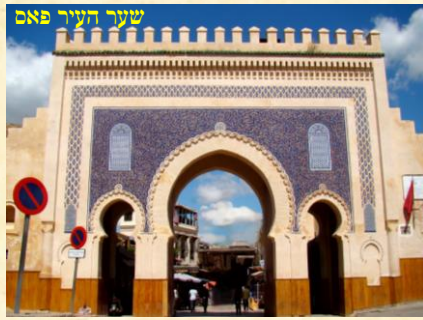
שער העיר פאס

העיר פאס נוסדה בשנת 807 על ידי אידריס השני, לאחר שהחליט להקים עיר בירה שתוכל להתחרות בדייק תכנונה ובתפארת בנייניה בערים אחרות כדוגמת בגדאד,