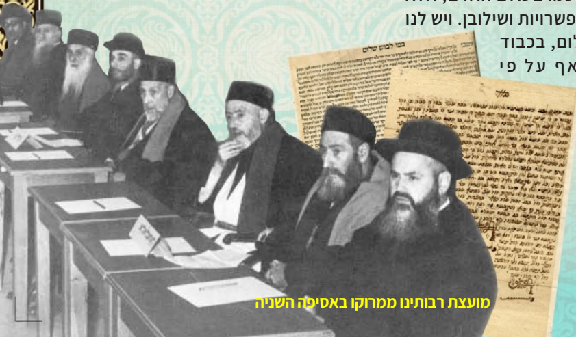
מועצת רבתינו ממרוקו באסיפה השנייה