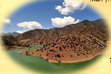
בתמונה: אזור סוס, מרוקו

בין כך ובין כך הדבר ברור שהייתה התיישבות קדומה ורצופה של יהודים במרוקו, אשר אחרי כן התרבתה עוד יותר לאחר חרבן הבית על ידי הגולים אשר הובאו שבי ביד הרומאים ויושבו בחבל ארץ ברבריה כפי שיבואר בע"ה בעלון הבא.