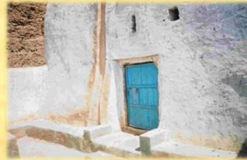
בתמונה: בית הכנסת באופראן. אחד מבתי הכנסת העתיקים ביותר במרוקו.