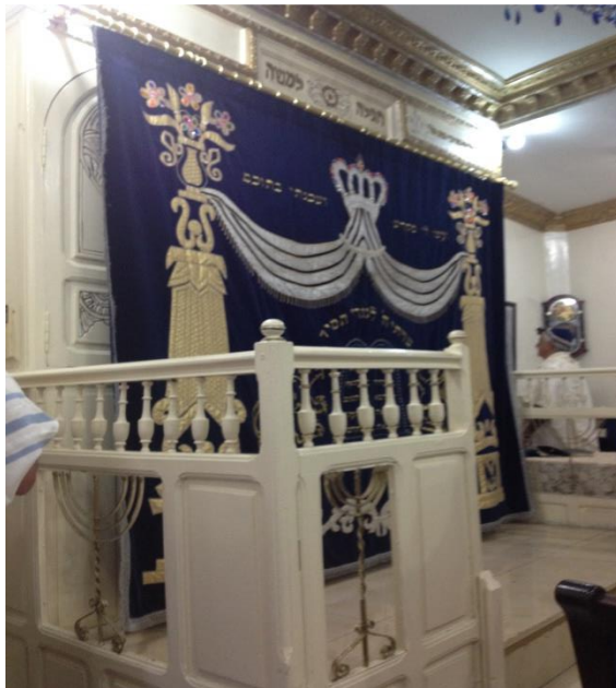
ההיכל ביהכ"נ החמאם (תפילה למשה) בקזבלנקה

דמי ביטול: מומלץ לעשות ביטוח ביטול!!!.... * 100$ מיום ההרשמה ועד 60 יום לפני הנסיעה * 150$ מ 60 יום ועד 21 יום לפני הנסיעה, ועוד עלות כרטיס הטיסה * 250$ מ 20 יום ועד 7 ימים לפני הנסיעה, ועוד עלות כרטיס הטיסה * מ 6 ימים ועד מועד היציאה מלוא מחיר הנסיעה