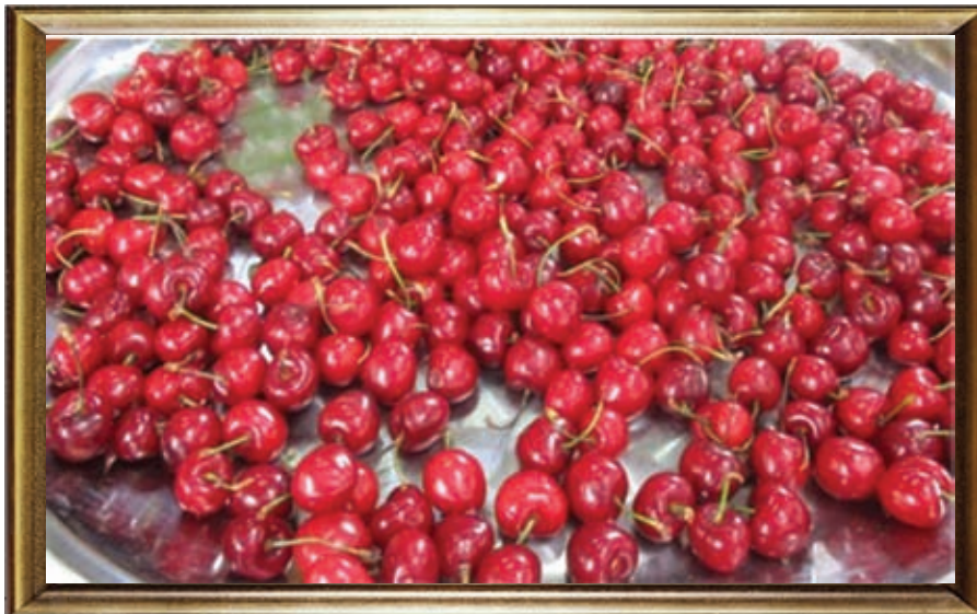
"חובה לזכור לשהו יפה... מחזורים, סוגים ואבנים. שישאלו שם מאוהב..."

"אני כבר לא סולחה השנינו. לא גבולות אצור יוגו לא אלוני, ואם אדוני, לא אנשתי, לא סולחה יש אוחה, יש מחזורים, אסוחה"