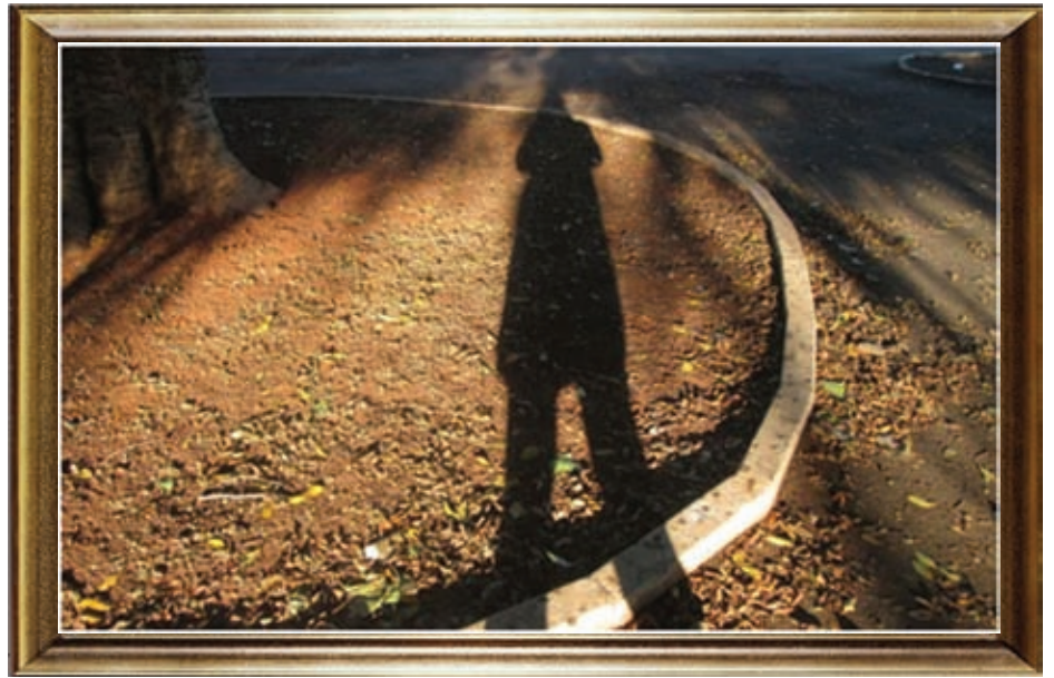
"אני חזקה שיש בחיים צרכים אחרים מאשר הצרכים שיש בגוף"