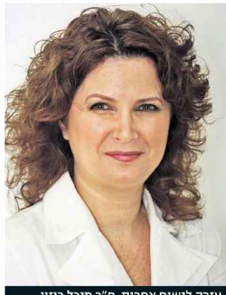
עזרה לנשים אחרות. ח"כ מיכל רוזין

כל המשפחה לא מדברת איתי בגלל 'הכביסה המלוכלכת', אבל יש אנשים מדהימים שקדאו את הספר ומספרים כמה הסיפור שלי העצים אותם. הצלחתי להתחתן לפני חודשיים ואני בזוגיות נפלאה". היום, כשהיא בת 58, סקולניק מרצה וגם מבקרת בכתי סוהר ומדברת בפני תוקפים. "החשיפה מאוד מפחידה ומאיימת", היא מודה. "יש לי שמונה ילדים, הקטן היה בן 22, ועד אז לא סיפרתי להם. אח שלי ראה את זה בטלוויזיה והגיע אליי למחרת במטרה לרצוח אותי, פיזית. מוזל שהבן שלי היה בבית. שני ימים לאחר מכן יצא הספר ואז כבר הייתי מוכנה. החשיפה הזאת הייתה פחות טראומטית?". מה תמליצי למי שמתלבטת היום? "חייבים להגיד להן מה המחיר. כשהן לא מודעות למחירי זה ממש כמו אונס חוזר. יש בנות שמתאשפות אחרי חשיפה. צריך הכנה מאוד טובה לקראתה".