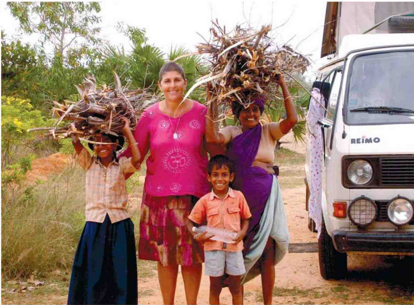
סקולניק. כל החיים היתה צל