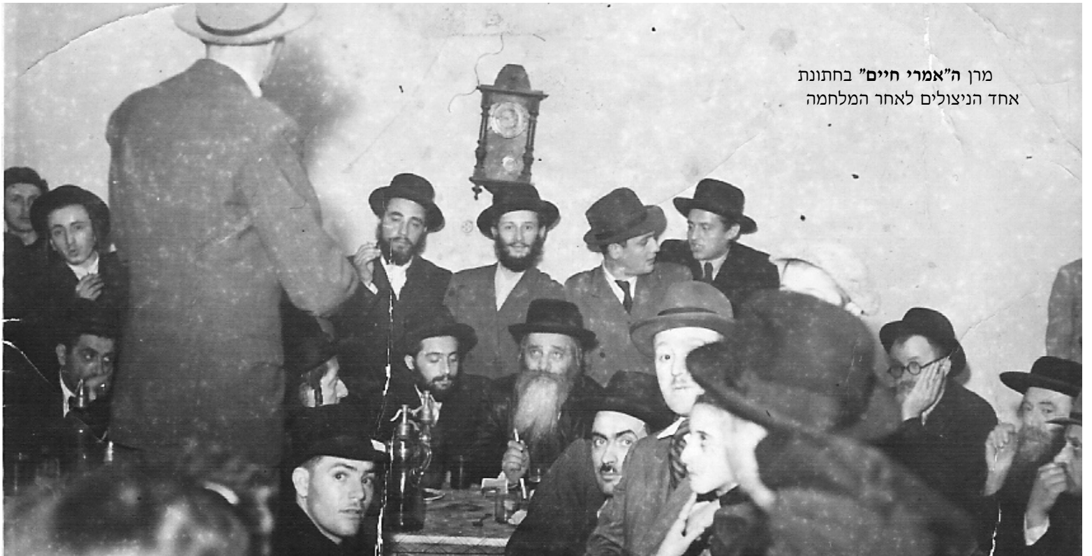
מרן ה"אמרי חיים" בחתונת אחד הניצולים לאחר המלחמה

האנשים שראו בעיני רוחם את הסכנות המרחפות עליהם ועל כל המפעל, ניסו תוך כדי גמגום והססנות לתמוך בדברי הפניה של העו"ד, באומרם שכדאי לחכות קצת עד יעבור זעם, כי אחרת הם מסכנים לא רק את עצמם אלא זה עלול לעלות במחיר חייהם של היהודים בטרנסניסטריה