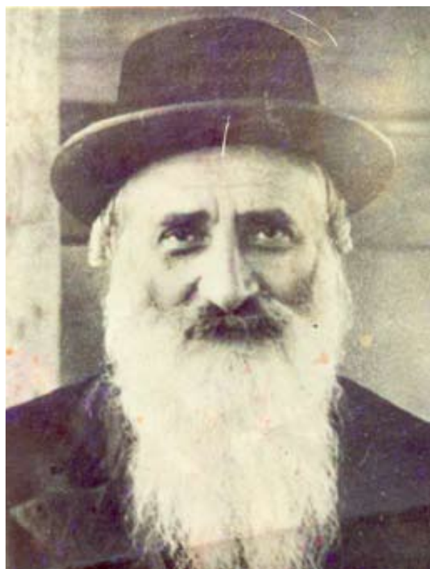
מרן ה"דמשק אליעזר" מויז'ניץ זי"ע

השרשרת, שקיבל במתנה מחותנו - החפץ יקר הערך האחרון שהיה ברשותו - כדי שאמכרנו ואתן את הכסף לקצין, למען פדיית אחותו, הרבנית העניא ע"ה, מטרנסניסטריה. את כל אשר לו מכר כדי לשלוח חבילות עם מלבושים ומאכלים לטרנסניסטריה. ארע פעם, כי סמוך לכניסת השבת הגיעה הודעה טלפונית, שקצין אחד הגיע כעת מטרנסניסטריה, ולמחרת בבוקר ישוב לשם והוא מוכן לקחת עמו כסף. הזדרזתי ללכת אל רבינו וסיפרתי לו על כך. מיד הוכנו כסף וחבילות ורבינו שלחני למוסרם לקצין.