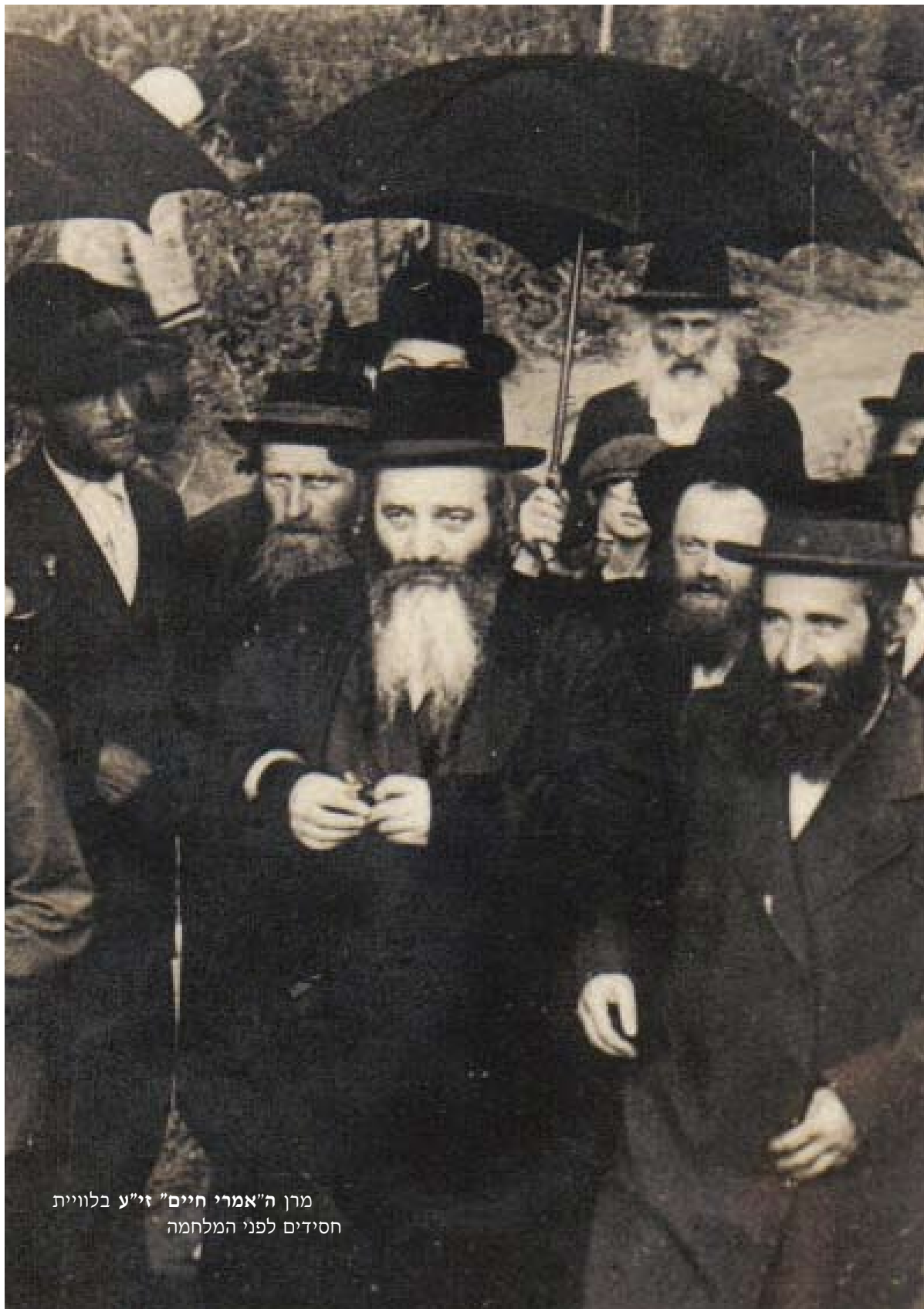
מרן ה"אמרי חיים" זי"ע בלוויית חסידים לפני המלחמה

חוסר אזרחות, אבל גם בעלי האזרחות ההונגרית לא שפר עליהם גורלם. השלטונות הוציאו פקודה, שכל גבר מגיל 18 עד 48 חייב לעבוד למען הצבא. פלוגות עובדי הכפיה הללו נשלחו לאוקראינה לשרת את הצבא ההונגרי שנלחם לצד הגרמנים. נוראה ואיומה היתה מנת-חלקם - הם הועסקו בעבודות קשות ומשפילות, כשמזונם דל ביותר, ללא ביגוד מתאים בקור העז, כך שרובם נפחו נשמתם בשל תנאי החיים הקשים ותחת עינויים של חיילי הצבא צמאי-הדם.