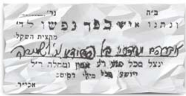
אישור על תרומה למען "כופר נפש" בכתי"ק ה"אמרי חיים" ז"ע

ואם הגזירה היא רח"ל על כלל ישראל, עלינו להתאמץ בכל כוחנו להעביר את רעת הרשעים ואת מחשבתם אשר חשבו על היהודים, ולהפך עזת אויבנו על-ידי תשובה, תפילה וצדקה". הציבור נענה לקריאת רבינו, והרים את תרומותיו למען הגולים. באותם ימים יצא הרבי במבצע "כופר נפש", בו הודפסו קבלות מיוחדות. הקבלות מולאו בכתב יד קדשו, ומרן כתב בהן את שמות המתנדבים בעם ומבוקשם. בפעם נוספת יצא רבינו במבצע הצלה - היה זה כאשר