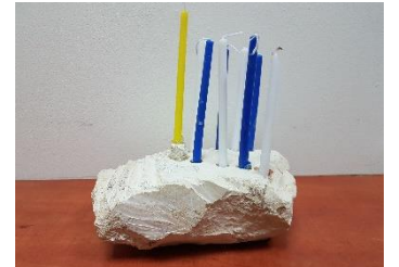
חלק מהחנוכיות שהכינו התלמידים