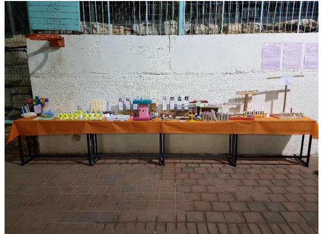
תערוכת חנוכיות שהכינו התלמידים