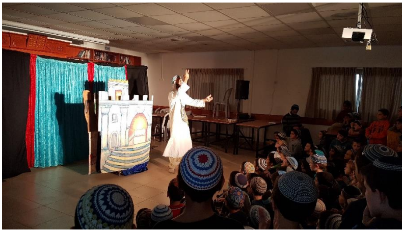
הצגה ניקנור ודלתות ההיכל