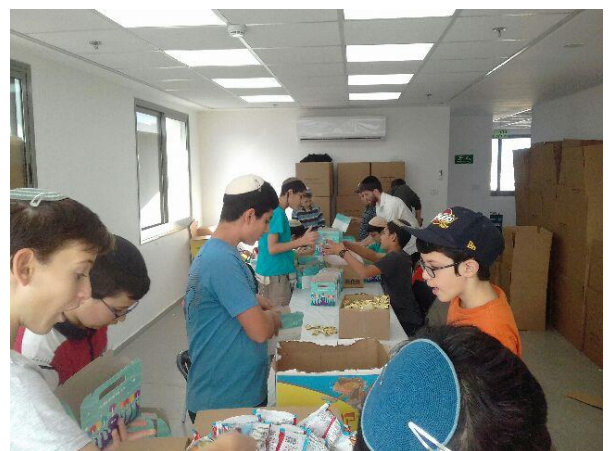
פעילות תלמידי כיתה ח' בארגון 'חסדי אנוש'