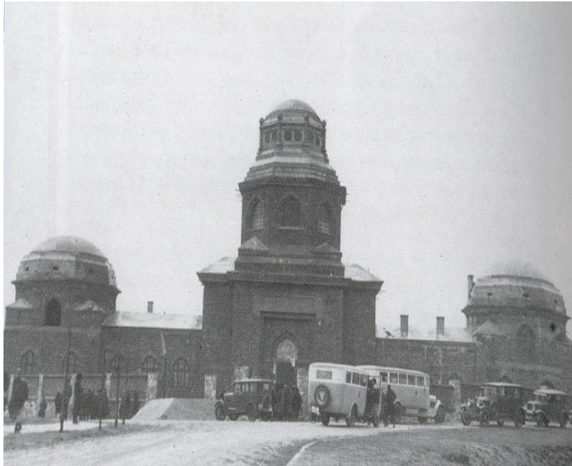
בית-ההלוויות של בית-העלמין החדש ברחוב אברהמה

בכניסה לבית-העלמין שברחוב אברהמה עמד בית-טהרה עצום ממדים, הבנוי בסגנון מזרחי - ביזנטי, עם שלוש כיפות שהאמצעית התנשאה לגובה של 20 מ'. 7 רעיונו של שטנדיג היה להחביא את ספרי-התורה בעליית-הגג את בית-ההלוויות. באותה עת, חודש מרץ 1941, עוד לא דובר כלל על הקמת מחנה פלאשוב במקום, ולכן הרעיון של הטמנת הספרים בבית-העלמין נראה מוצלח ביותר. כעבור ימים אחדים, החל המבצע של הוצאת 150 ספרי-התורה מהגטו והעברתם לבית-העלמין החדש. לשם כך, ניצל היודנראט יהודים שעבדו כפועלים בבית-הקברות, ואלה העבירו מידי יום ספרי-תורה והסתירו אותם בעליית-הגג של בית-ההלוויות. לאחר שהמבצע הוכתר בהצלחה, נעלו את דלת הברזל, טייחו את הכניסה לעליית-הגג וסילקו את הסולם שבעזרתו ניתן היה לטפס למעלה. שטנדיג והמעורבים במבצע חזרו לגטו בתחושת סיפוק, ו"יהדות קרקוב נשמה לרווחה". 8