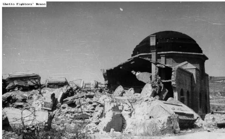
שרידי בית ההלוויות