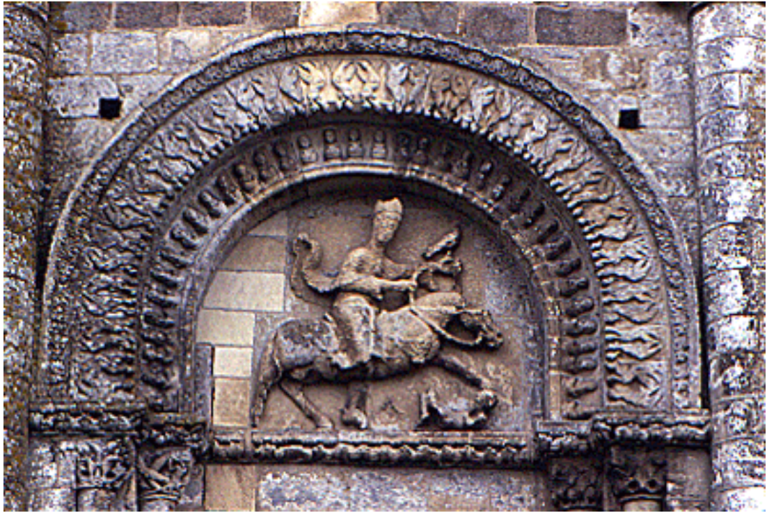
תמונה מספר 10