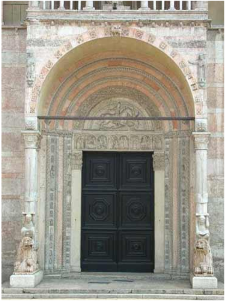
תמונה מספר 4