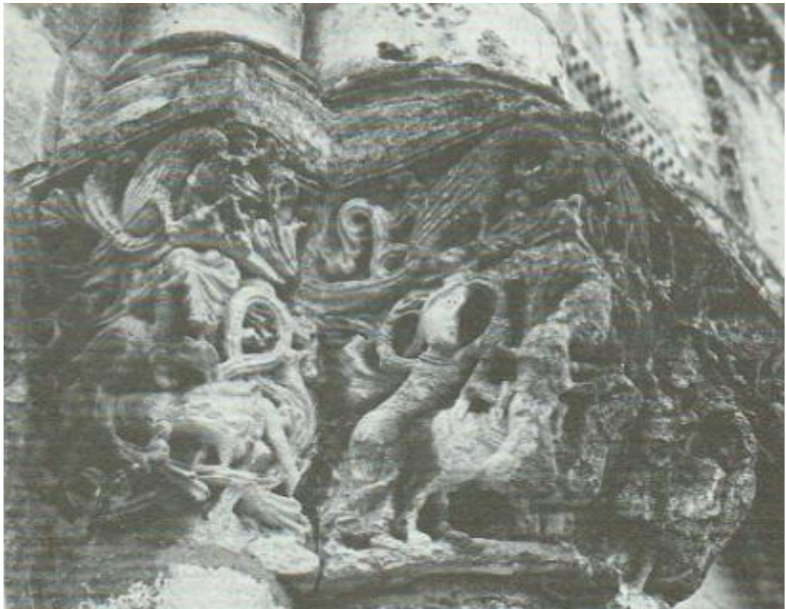
תמונה מספר 11