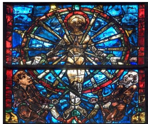
תמונה מספר 3