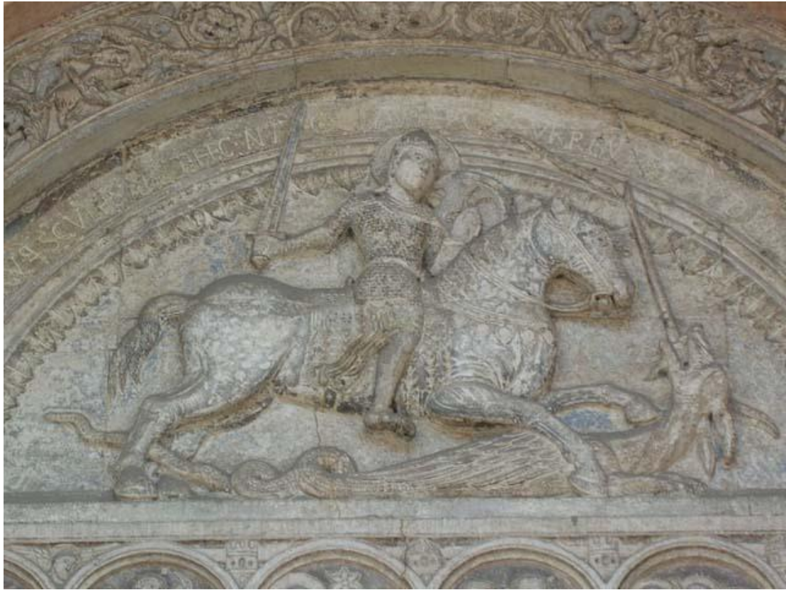
תמונה מספר 6