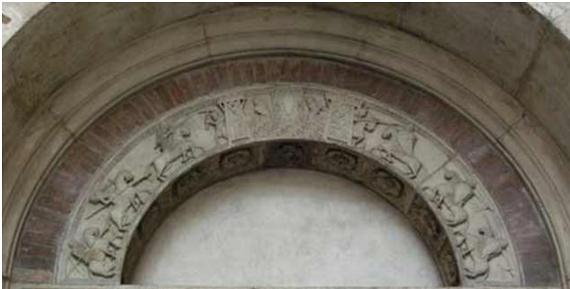
תמונה מספר 7