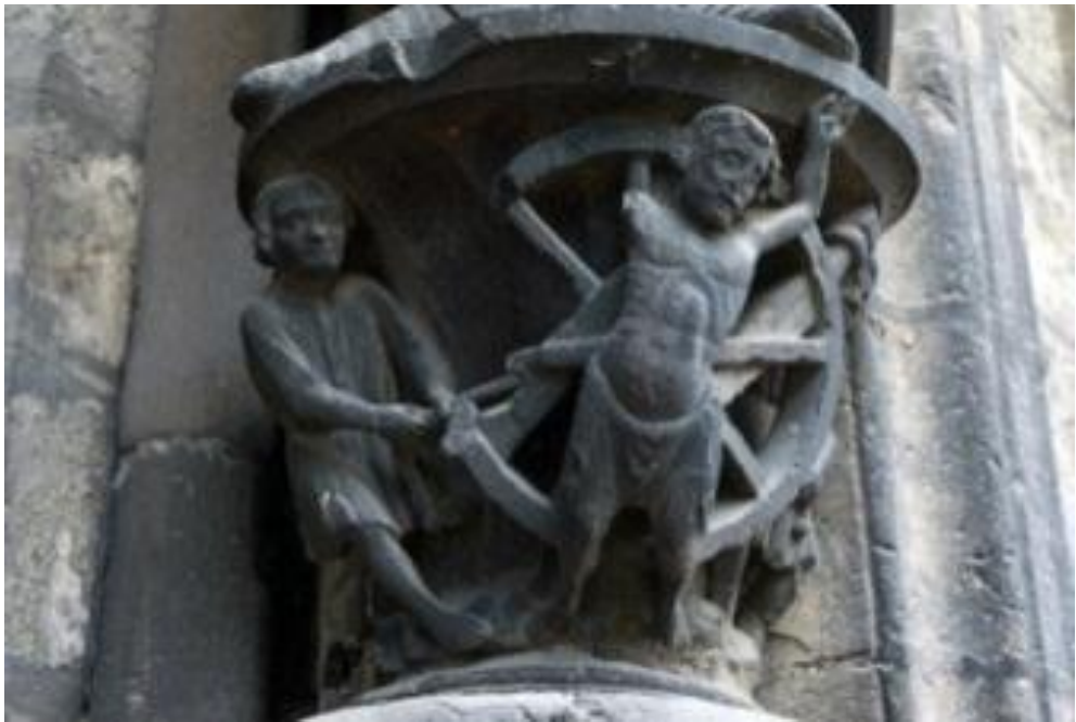
תמונה מספר 2