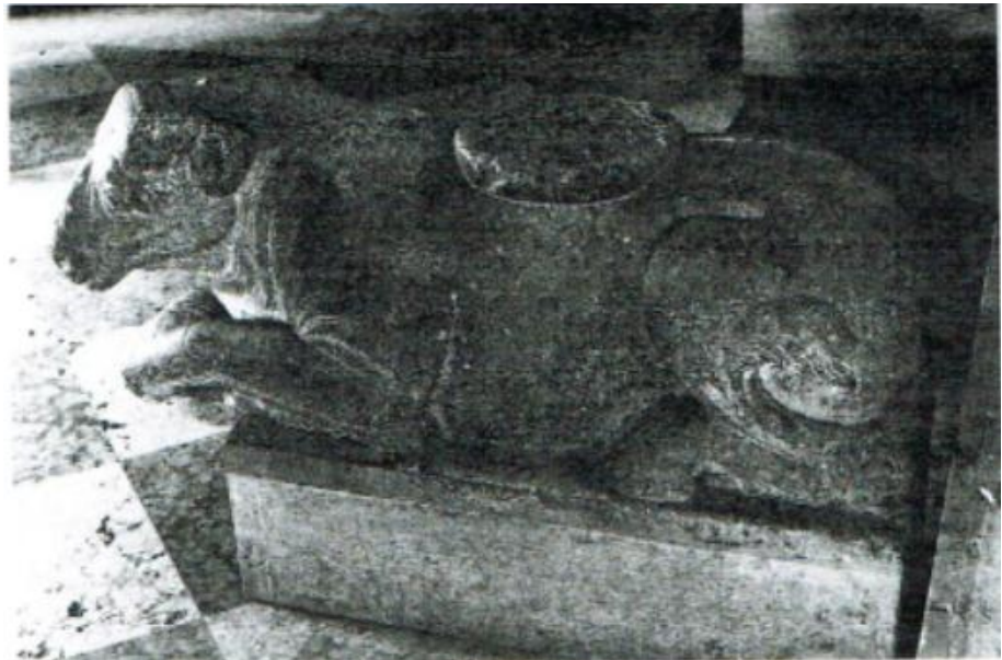
תמונה מספר 5