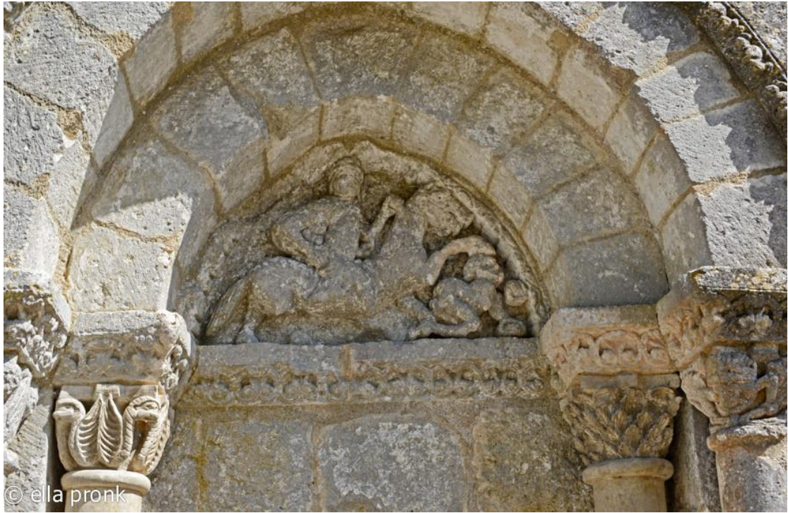
תמונה מספר 12