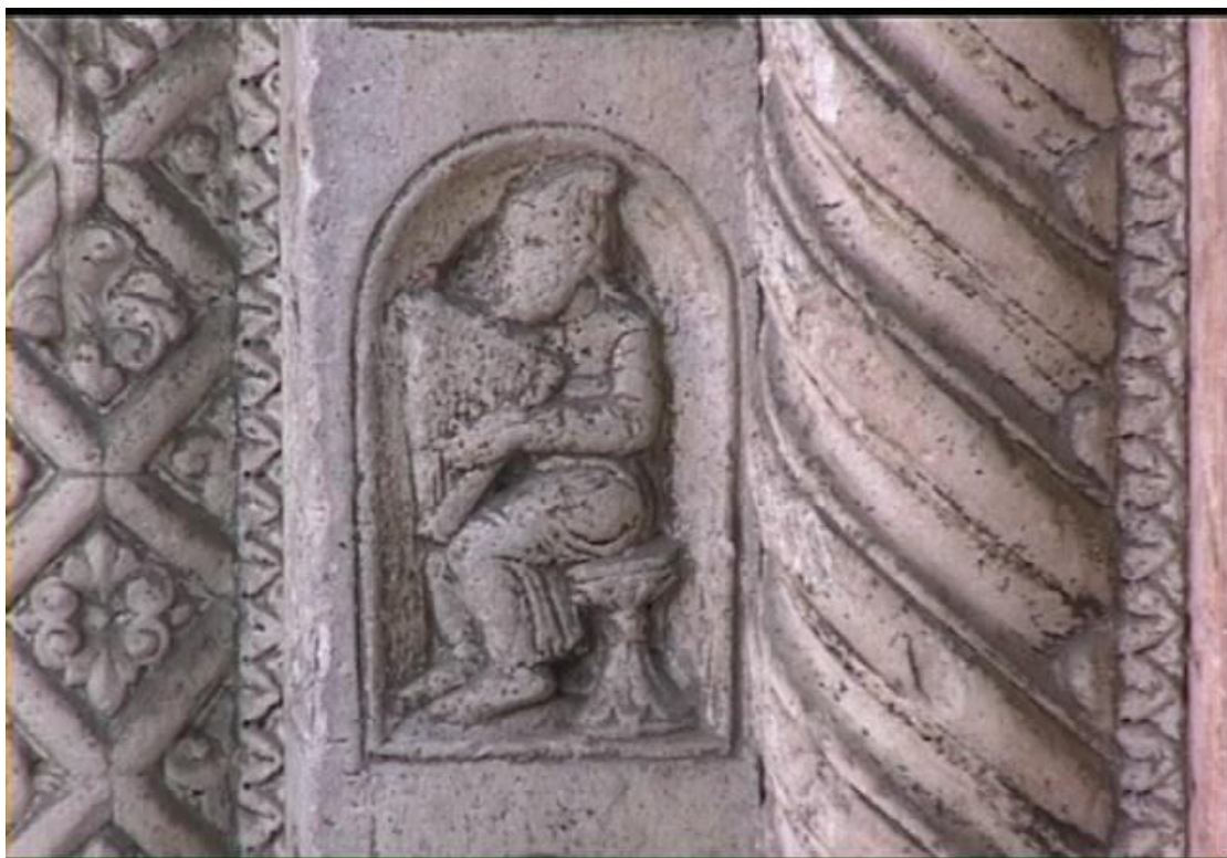
תמונה מספר 9