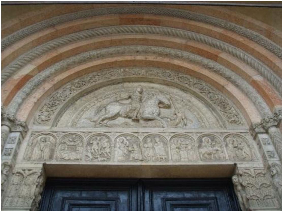
תמונה מספר 8